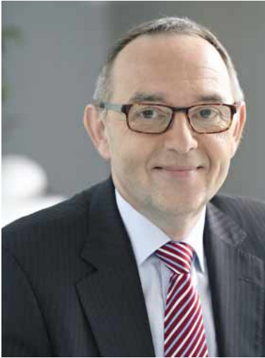
Dr. Norbert Walter-Borjans Finanzminister des Landes Nordrhein-Westfalen