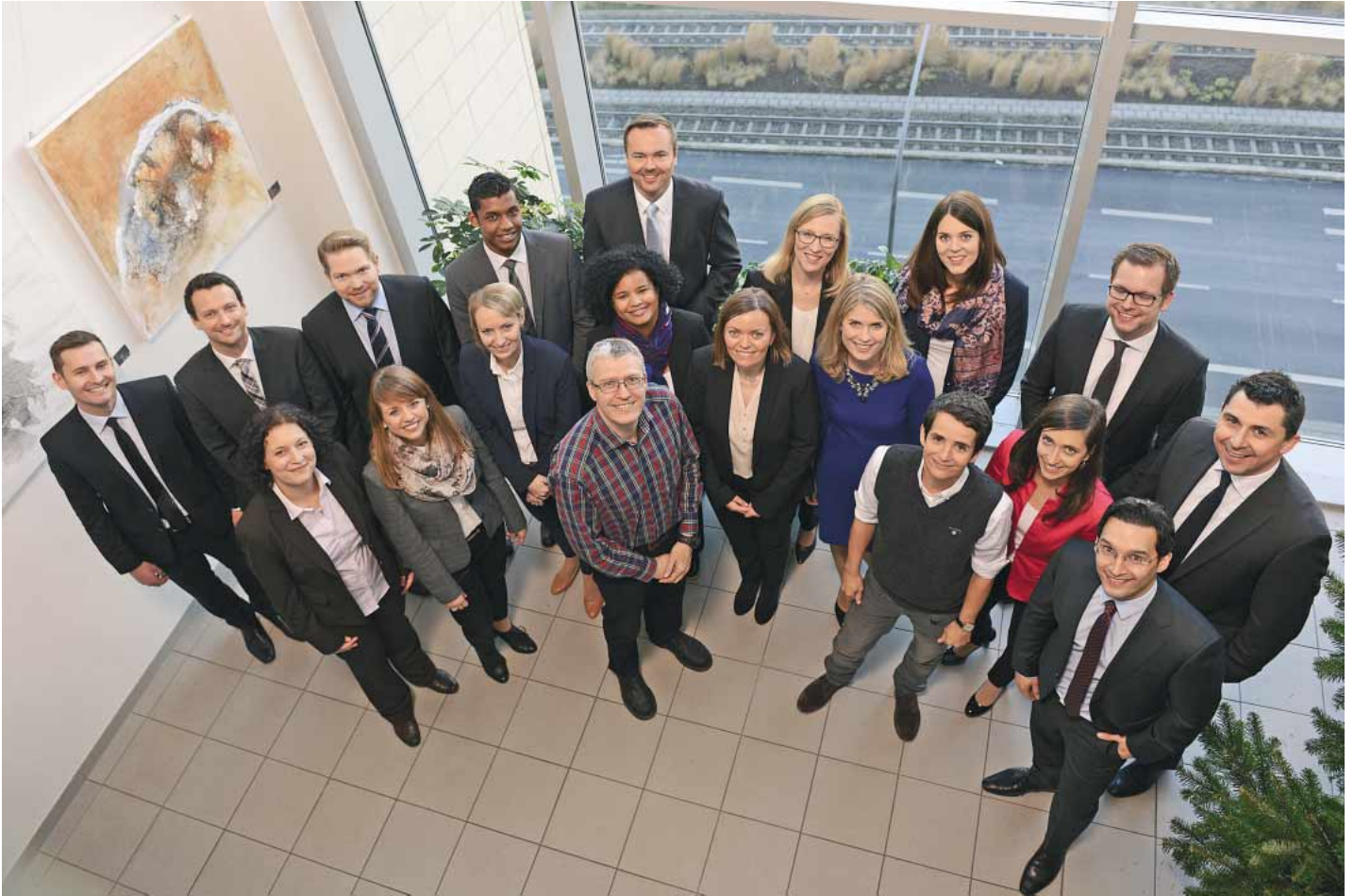
Mitarbeiterinnen und Mitarbeiter der Finanzverwaltung beim Fotoshooting im Finanzamt Essen-NordOst im November 2015