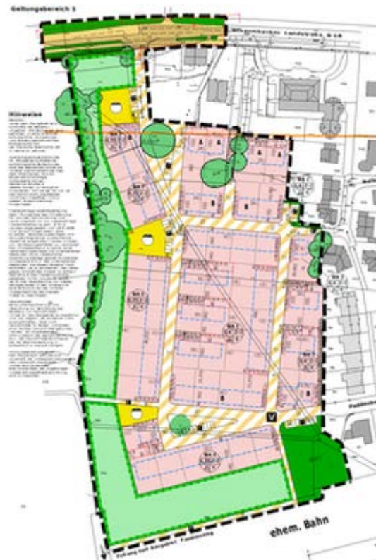
Abb.: Geltungsbereich Nr. 1 des Bebauungsplanes Nr. 45 „Nelkenstraße“

Die Geltungsbereiche des Bebauungsplanes Nr. 45 „Nelkenstraße“ in Hünxe-Drevenack können den nachfolgenden Planskizzen entnommen werden.