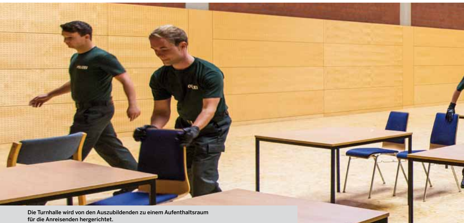
Die Turnhalle wird von den Auszubildenden zu einem Aufenthaltsraum für die Anreisenden hergerichtet.