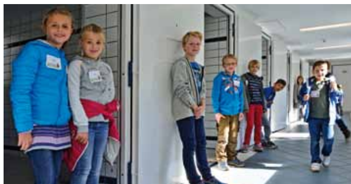
Spannender Einblick in den Polizeialtag beim Besuch des Polizeigewahrsams des PP Essen