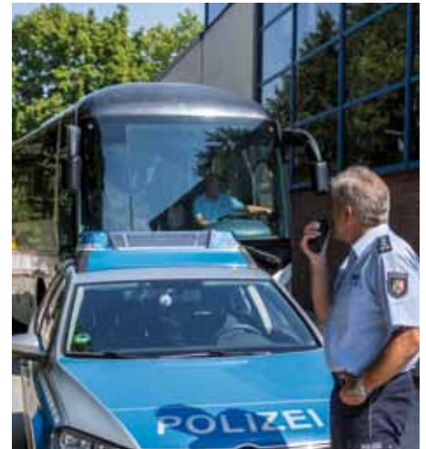
Polizeibeamte der Kreispolizeibehörde Unna koordinieren die Anfahrt der anreisenden Busse mit den Flüchtlingen.