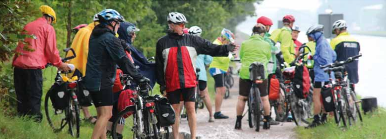
Die widrigen Wetterverhältnisse hielten die Teilnehmer nicht davon ab, quer durch das Münsterland zu radeln, um Spendengelder für die Stiftung zu sammeln.