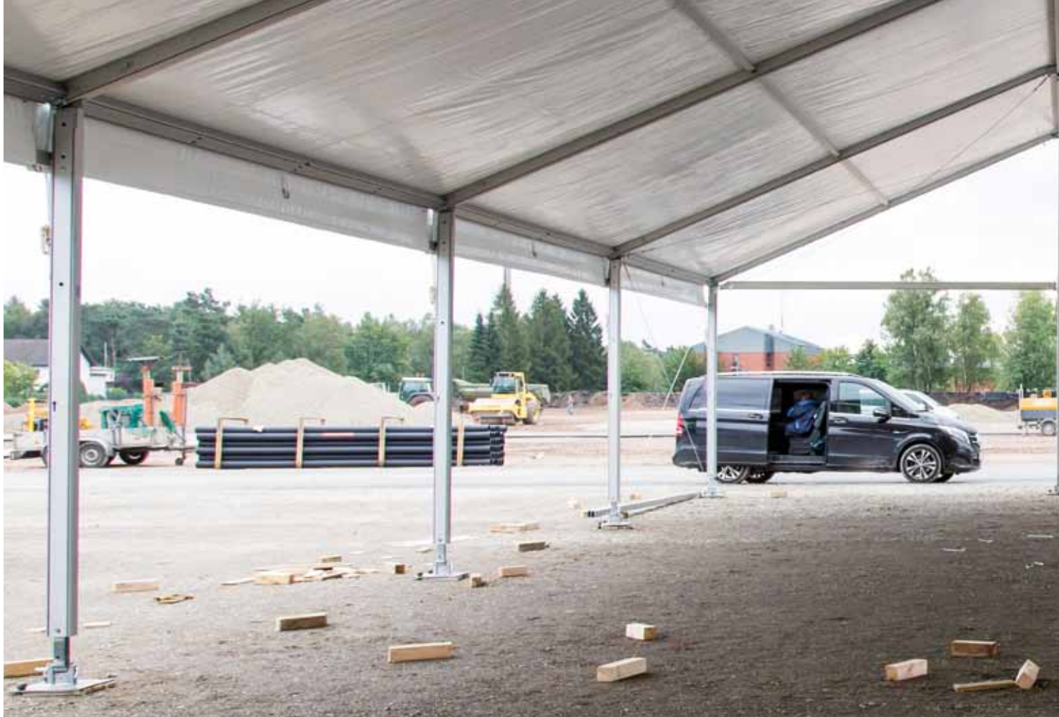
In weniger als zwölf Stunden wurden in Schloß Holte-Stukenbrock Unterbringungsmöglichkeiten für 500 Flüchtlinge in bestehenden Gebäuden und Räumen geschaffen. Zeitgleich wurden in der Liegenschaft bereits mehrere Zelte für weitere Anreisende aufgebaut.