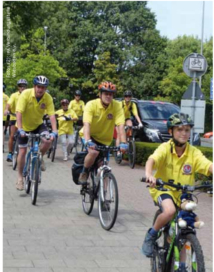
Der von den Teilnehmern erradelte Erlös geht unter anderem an das »Waldpiraten-Camp« der Deutschen Kinderkrebsstiftung in Heidelberg.