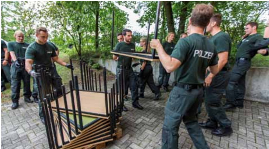
Auszubildende der Polizei NRW helfen, die Unterkünfte für die Flüchtlinge in Schloß Holte-Stukenbrock einzurichten.