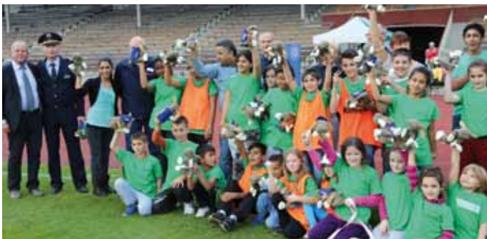
Die Kinder und Jugendlichen der Flüchtlingsunterkunft in Dortmund freuten sich über Polizeihund »Socke«.

Sechzehnjährigen im Stadionrund bei den Laufdisziplinen, im Weitsprung und Ballwurf. Im Anschluss freuten sich die Kinder außerdem über Polizeihund »Socke«, das beliebte Stofftier der Polizei NRW.