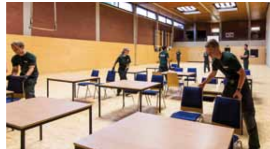
04 POLIZEI NRW UNTERSTÜTZT MIT VEREINTEN KRÄFTEN