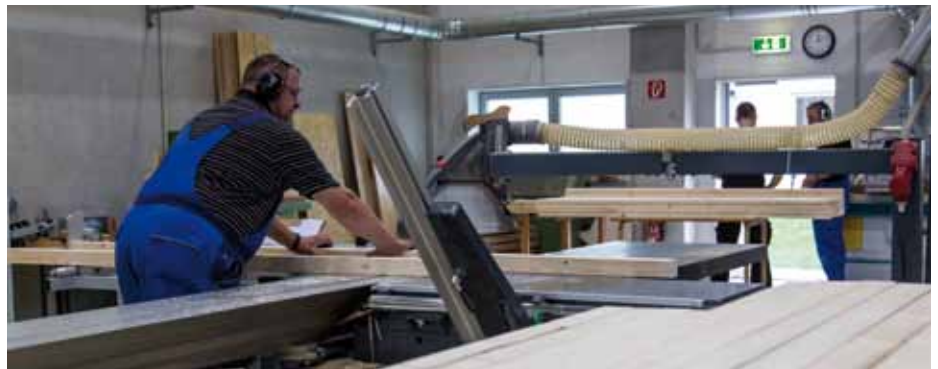
Um den Anreisenden in den offengehaltenen Unterkünften wie der Turnhalle Privatsphäre zu gewährleisten, wurden in der Schreinerei des Bz Schloß Holte-Stukenbrock Trennwände konzipiert und erstellt.

die Turnhalle so ausgestattet, dass eine Unterbringung von 500 Personen möglich war. Am folgenden Tag erreichten dann gegen Mittag die ersten Busse mit Flüchtlingen die Liegenschaft. Es folgte die Aufnahme der notwendigen Personalien, die Zuweisung eines Zimmers sowie das Verteilen von Hygienebeuteln. Schnell war die neu geschaffene Notunterkunft mit 500 Flüchtlingen voll belegt. Rund 90 Prozent der Gäste stammen aus Syrien, Afghanistan und dem Irak, über die Hälfte von ihnen sind Männer, ein Viertel Kinder.