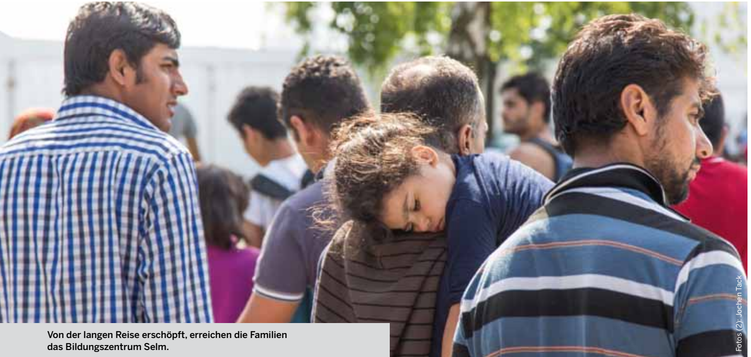
Von der langen Reise erschöpft, erreichen die Familien das Bildungszentrum Selm.