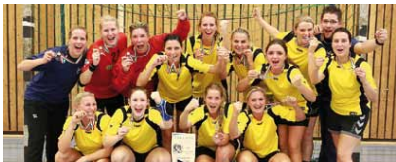
Die Spielgemeinschaft PP Dortmund/LAFP NRW kämpfte hart um den Titel. Mit 19:14 Toren nach Verlängerung konnte sich das Team durchsetzen und war der neue »Polizeilandesmeister im Handball der Frauen«.