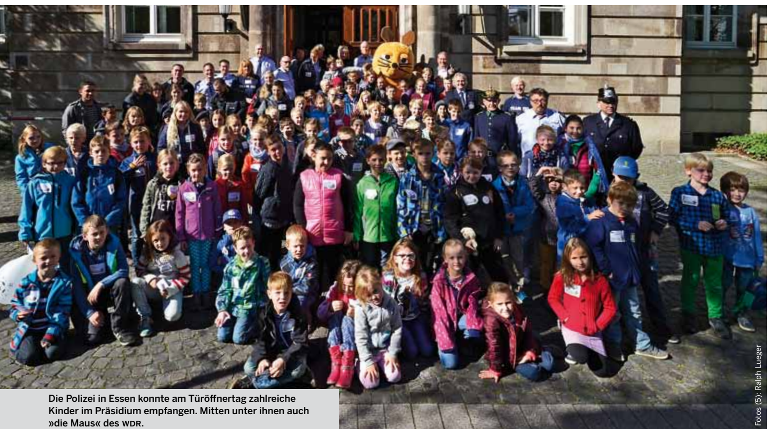
Die Polizei in Essen konnte am Türöffnertag zahlreiche Kinder im Präsidium empfangen. Mitten unter ihnen auch »die Maus« des WDR.