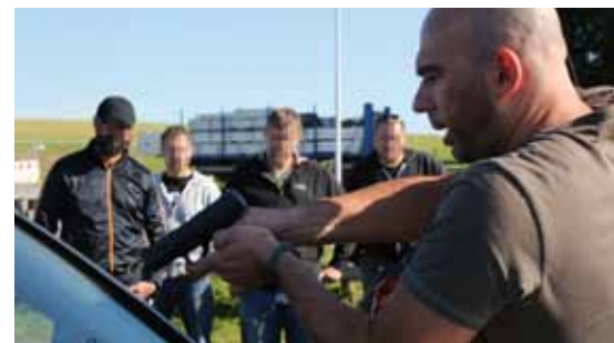
30 FORTBILDUNGSANGEBOT ZUR OBSERVATION VON REISENDEN TÄTERGRUPPEN