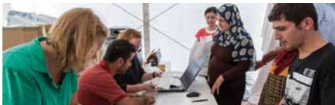
Da, wo Sprache noch fehlt, helfen Bilder bei der Verständigung: Die Flüchtlinge bekommen ihre Unterkunft im Bildungszentrum Selm zugewiesen.

Meine neue Aufgabe in der Erstaufnahmeeinrichtung in Dortmund ist es, die asylsuchenden Menschen zu registrieren. Ich sitze an einem Schreibtisch hinter einer Glasscheibe und gebe Daten in den Computer ein. Die Flüchtlinge händigen mir hierzu ihre Karteikarten mit Personaldaten sowie ausgefüllte Belehrungs- und Selbstauskunftsbögen aus – die Wenigsten führen Ausweisdokumente mit sich. Kommuniziert wird in den unterschiedlichsten Sprachen, oftmals auch mit Gesten.