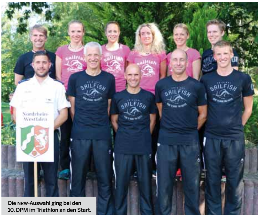
Die NRW-Auswahl ging bei den 10. DPM im Triathlon an den Start.