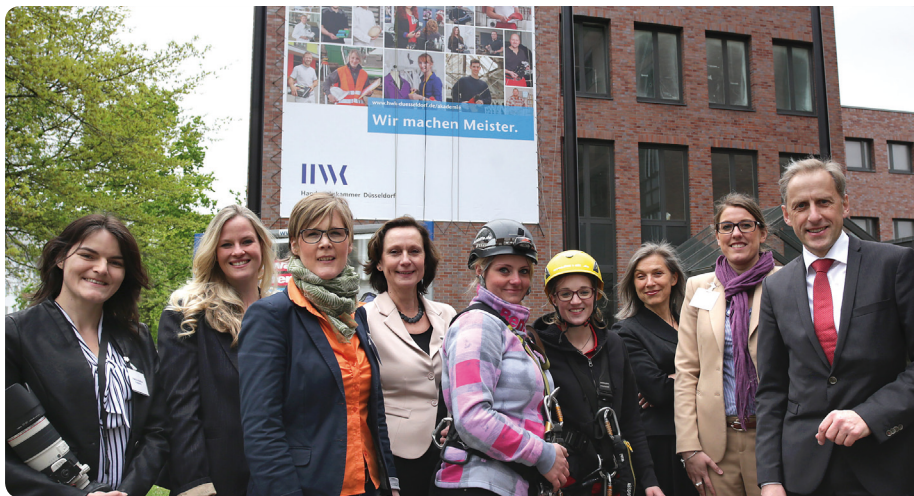
Viel los bei der „Premiere“ in der Handwerkskammer

Am 27. April 2015 veranstaltete die Handwerkskammer Düsseldorf in Zusammenarbeit mit dem Kompetenzzentrum die Kooperationsveranstaltung „Frauen gehen in Führung“.