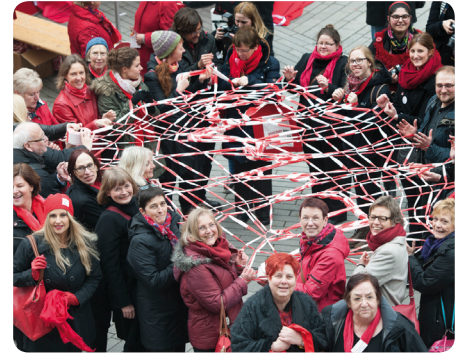
Aktion „Guerilla Knitting“ zum Equal Pay Day 2015