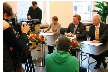
Unterzeichnung des Kooperationsvertrages im Rathaus der Landeshauptstadt Düsseldorf am 23. Februar 2012

Das Kompetenzzentrum berät kleine und mittlere Unternehmen dabei, weibliche Fachkräfte zu gewinnen und an sich zu binden, gibt Tipps zur besseren Vereinbarkeit von Familie und Beruf und hilft, die Potenziale der Frauen im Unternehmen weiterzuentwickeln. Anhand von Beispielen aus der Praxis wird den Unternehmen aufgezeigt, was geht und wie es geht. Gemeinsam mit verschiedenen Koope-