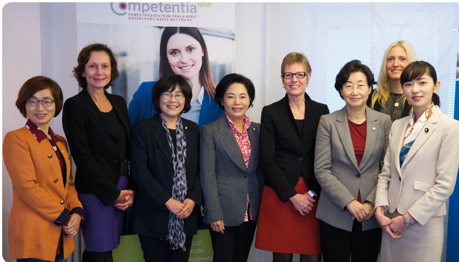
Das Auswärtige Amt Berlin war im Sommer 2014 mit einer Delegation aus Japan und der Republik Südkorea im Kompetenzzentrum.

Großer Informationsbedarf ausländischer Delegationen – das Team des Kompetenzzentrums stand u. a. einer Gruppe aus dem Auswärtigen Amt Berlin mit Expertenrat zur Seite.