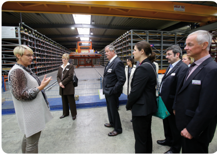
Firmenbesichtigung bei MECU-Metallhalbezeug GmbH & Co. KG