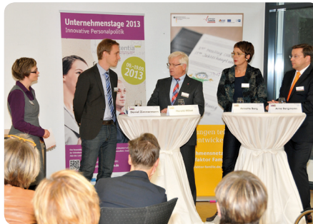
Talkrunde zum Thema „Einrichtung einer Betriebskita“ für KMU

flexible Kinderbetreuung“ zeigte den Unternehmen die verschiedenen Angebote und Vorteile betrieblicher Kinderbetreuung auf. Tagesmütter, Kleingruppenbetreuung oder Kindertagesstätte: Für die Mitarbeitenden gibt es viele Möglichkeiten. Doch vor allem für die Bindung von Mitarbeiterinnen und Mitarbeitern an das Unternehmen sind betriebsinterne Lösungsmöglichkeiten besonders wichtig. Das „1. Frauen-Wirtschaftsforum Düsseldorf“ in Kooperation mit der IHK Düsseldorf war mit 180 Teilnehmenden der Höhepunkt und Abschluss der „Unternehmenstage 2013“. Die Mitarbeiterinnen des Kompetenzzentrums zogen ein positives Fazit aus den Unternehmenstagen. Die Besucherinnen und