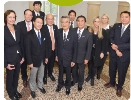
Regierungsvertreter Tokios informierten sich bei der Wirtschaftsförderung Düsseldorf und dem Kompetenzzentrum.

gen Heirat und Nachwuchs. Dies führt dazu, dass sich die Firmen mit dem Thema Vereinbarkeit von Familie und Beruf nur bedingt auseinandersetzen. Das Kompetenzzentrum begrüßte es sehr, dass sich die verschiedenen Gruppen für mehr Chancengleichheit auf den heimischen Arbeitsmärkten einsetzen. Es wurden wichtige Hinweise zu einer frauen- und familiengerechteren Personalpolitik weitergegeben.