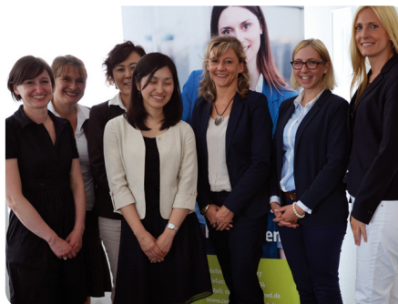
Zu Gast: Mitarbeiterinnen der Firma Daikin Industries

Im Mittelpunkt der Gespräche standen der Austausch zu Fördermöglichkeiten von Frauen im Unternehmen, die Weiterentwicklung des Teilzeitrechts und die neuen Gesetze zur besseren Vereinbarkeit von Familie, Pflege und Beruf sowie zum „ElterngeldPlus“. Gerade in Japan und Südkorea scheiden aufgrund patriarchalisch geprägter