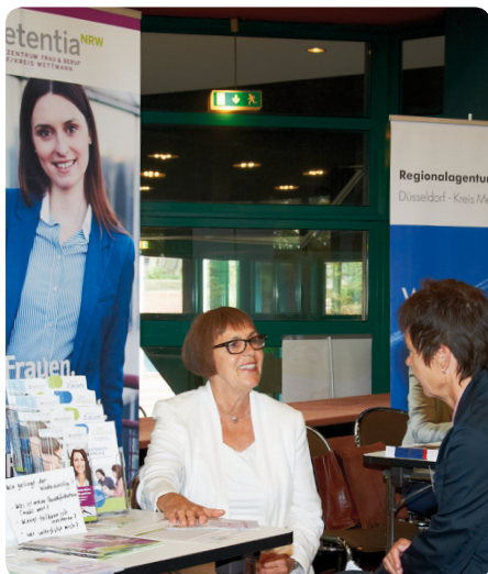
Die Zukunftswerkstatt Düsseldorf auf dem „Infotag Wiedereinstieg“

In der Projektgruppe „Flexible Kinderbetreuung im Kreis Mettmann“ wurde 2013 die Randzeitenbetreuung im Kreis Mettmann erfasst, und in einer zweiten Projektgruppe wurde an der Broschüre