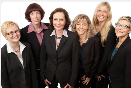
Das Team des Kompetenzzentrums 2012–2014

rationspartnerinnen und -partnern, wie Kammern, Berufsverbänden oder Wirtschaftsförderungen, werden Projekte entwickelt und begleitet.