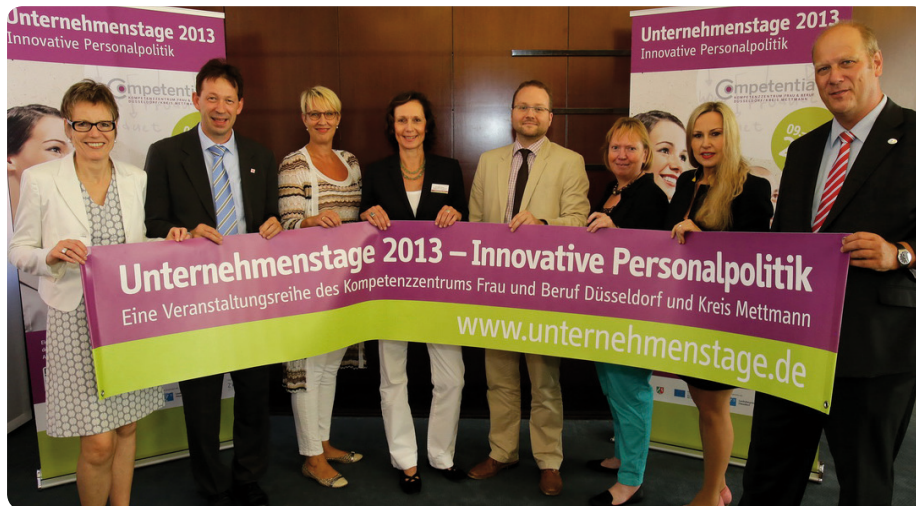
Kooperationspartnerinnen und -partner stellen die Zielsetzung der „Unternehmenstage 2013“ auf einer Pressekonferenz vor.

Zehn Veranstaltungen an zehn Tagen: Die „Unternehmenstage 2013“ unter dem Motto „Innovative Personalpolitik“ brachten 2013 große Öffentlichkeit und positive Resonanz.