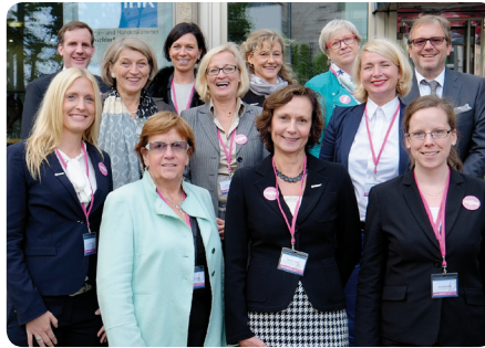
Veranstalterinnen und Referentinnen und Referenten des „Frauen-Wirtschaftsforums Düsseldorf – women@work“