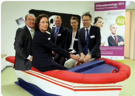
Hier drehte sich alles um das Thema Kindertagesstätten, Fördermöglichkeiten und Rahmenbedingungen.