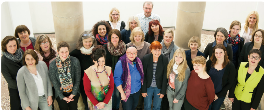
Die Partnerinnen und Partner des „Düsseldorfer Netzwerks zur Förderung der beruflichen Entwicklung von Frauen“

Institutionen, Netzwerke und Projekte der Region bei ihren frauen-, familien- und arbeitsmarkt-politischen Aktivitäten zu unterstützen, gehört zu den Kernaufgaben des Kompetenzzentrums.