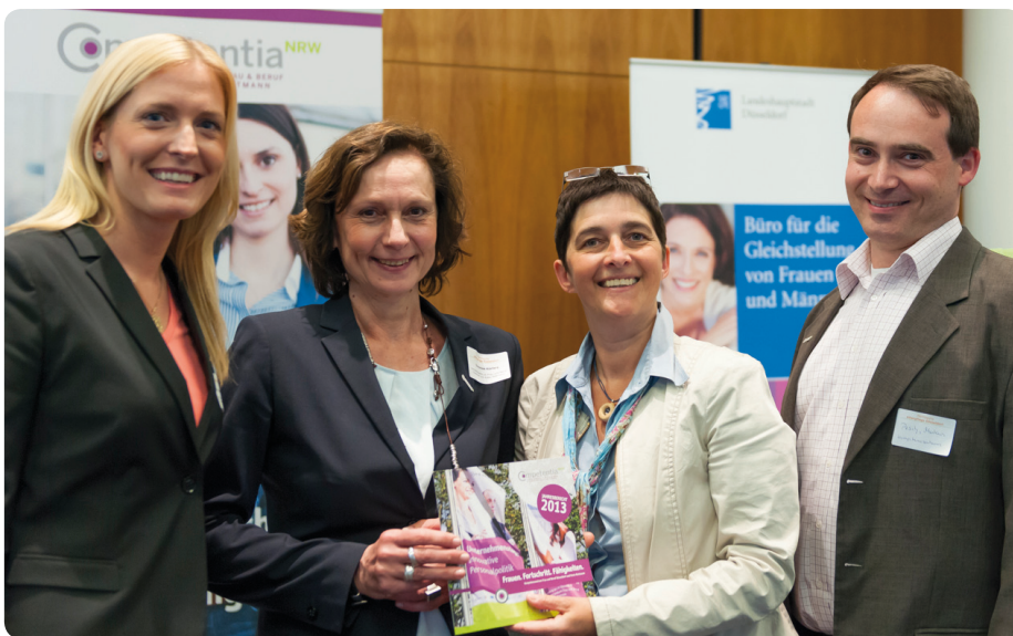
Ministerin Barbara Steffens am Informationsstand des Kompetenzzentrums am 20. April 2015