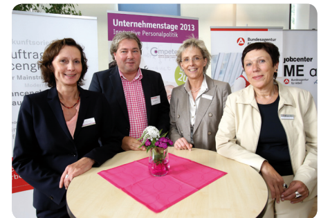
Vorstellung der Vorteile und Nutzen einer familienorientierten Personalpolitik für Unternehmen

Insgesamt besuchten rund 400 Personen die verschiedenen Veranstaltungen der „Unternehmenstage 2013 – Innovative Personalpolitik“. Auf große Resonanz stieß die Initiative der Firma MECU-Metallhalbzeug GmbH & Co. KG, die sich für die Vereinbarkeit von Pflege und Beruf einsetzt. Dabei geht es um die Unterstützung von Mitarbeiterinnen und Mitarbeitern, die ihre Angehörigen