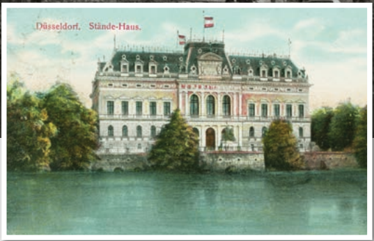
Historische Postkarte von 1902.

fanden hier Sitzungen des Landesparlaments statt. Seit 2002 ist der Bau als Museum K21 Dependance der Kunstsammlung NRW.