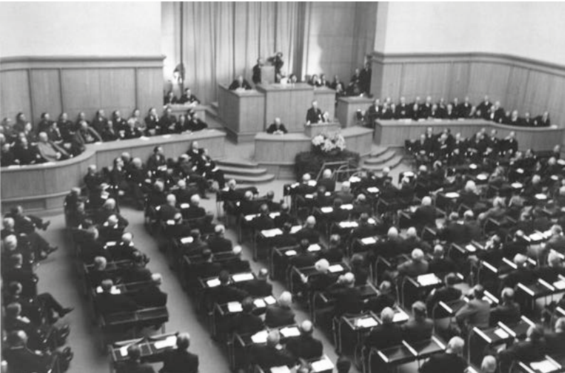
Plenarsitzung anlässlich der Einweihung des Ständehauses am 15. März 1949 (Blick von der Tribüne).