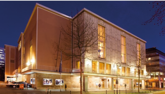
Opernhaus (Neubau), Heinrich-Heine-Allee 16A, 40213 Düsseldorf