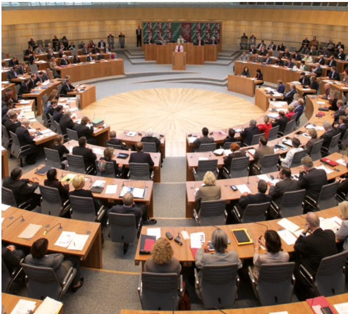
Kreisförmige Sitzanordnung im Plenarsaal.

Weitere Informationen finden Sie unter: www.wege-der-demokratie.nrw.de und unter www.landtag.nrw.de