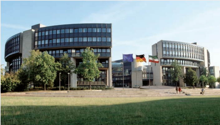
Landtag Nordrhein-Westfalen, Platz des Landtags 1, 40221 Düsseldorf