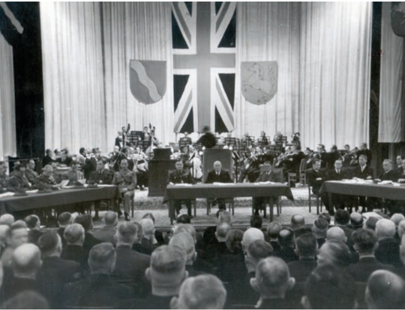
Im Düsseldorfer Opernhaus konstituierte sich der Landtag am 2. Oktober 1946 – ein historischer Tag für Nordrhein-Westfalen.