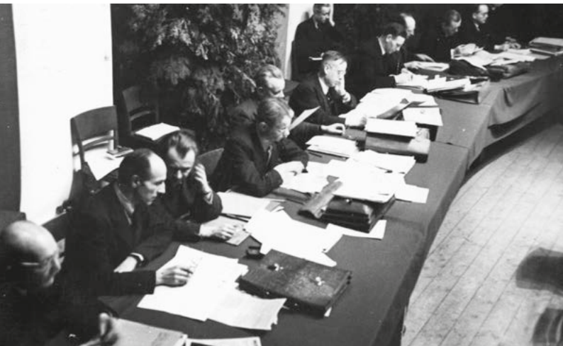
Im „Gesolei-Saal“ fanden insgesamt 90 Plenarsitzungen statt.