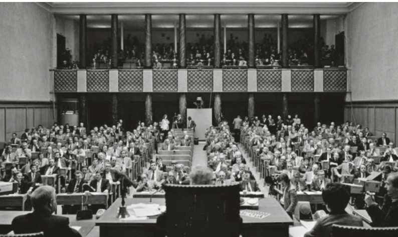
Blick vom Präsidium auf Plenarsaal und Tribüne.