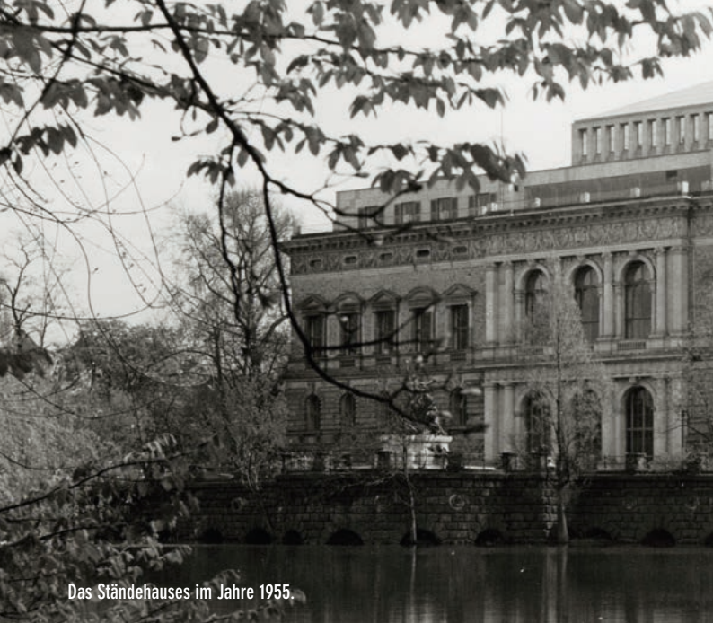
Das Ständehauses im Jahre 1955.