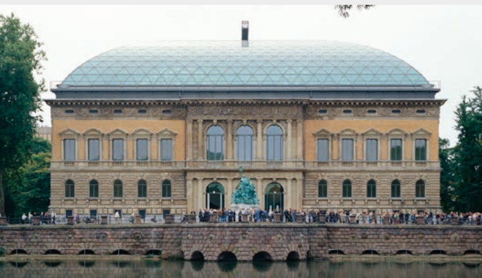
Ständehaus, Ständehausstraße 1, 40217 Düsseldorf