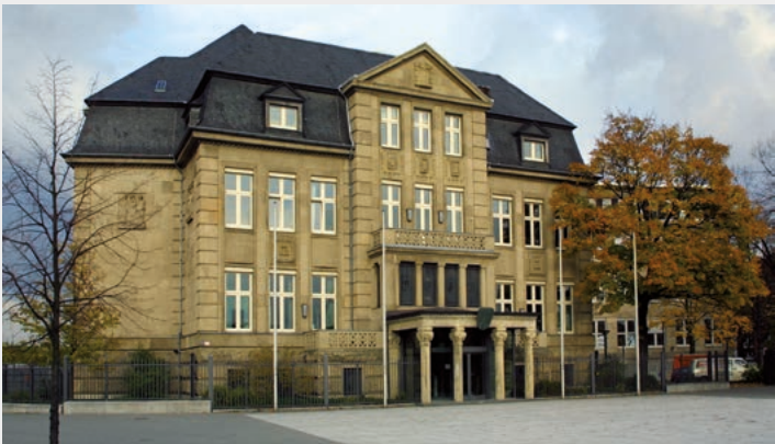
Villa Horion, Johannes-Rau-Platz, 40213 Düsseldorf