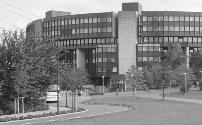
Sitz des NRW-Parlaments seit 1988.