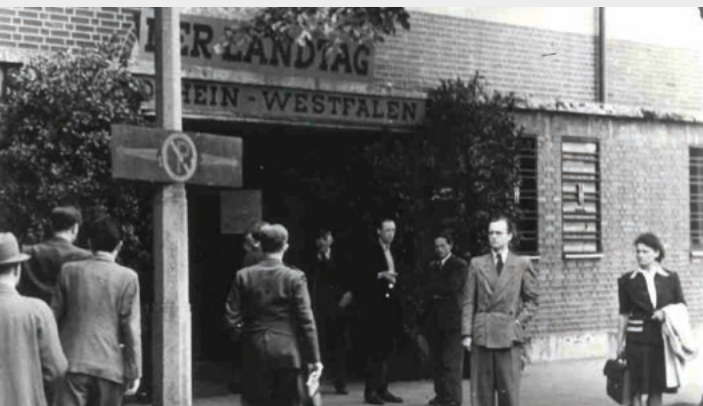
Henkel-Werke*, Henkelstraße 67, 40589 Düsseldorf-Holthausen