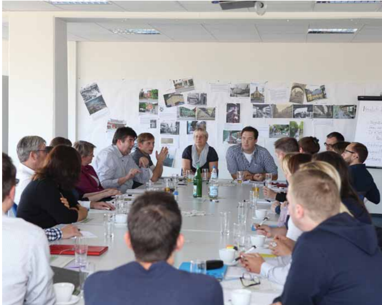
In der zweiten Jahreshälfte 2014 startete das Projektteam die Vermittlungskampagne.

Die Vermittlungskampagne „Die Einstellung macht's“ des Jobcenters war ein Erfolg: Über 1.200 Kundinnen und Kunden mit der „richtigen Einstellung“ wurden im Rahmen der Kampagne gefördert, um ihre Einstellungs-chancen zu erhöhen. Mit einem interes-santen Angebot für die Teilnehmerinnen und Teilnehmer entstand eine neue Dynamik und ihre Motivation erhöhte sich – rund 400 fanden tatsächlich eine neue Stelle.