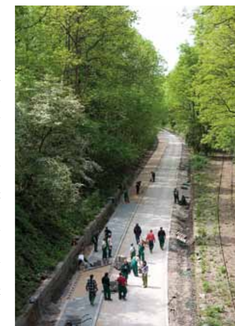
Die Nordbahntrasse ist ein gutes Beispiel für eine sinnvolle Beteiligung des zweiten Arbeitsmarktes.

breites Angebot für die „Schwächeren“ und individuelle Hilfen im Allgemeinen geben dem Jobcenter auf seinem Weg, den es für Wuppertal eingeschlagen hat, Recht.