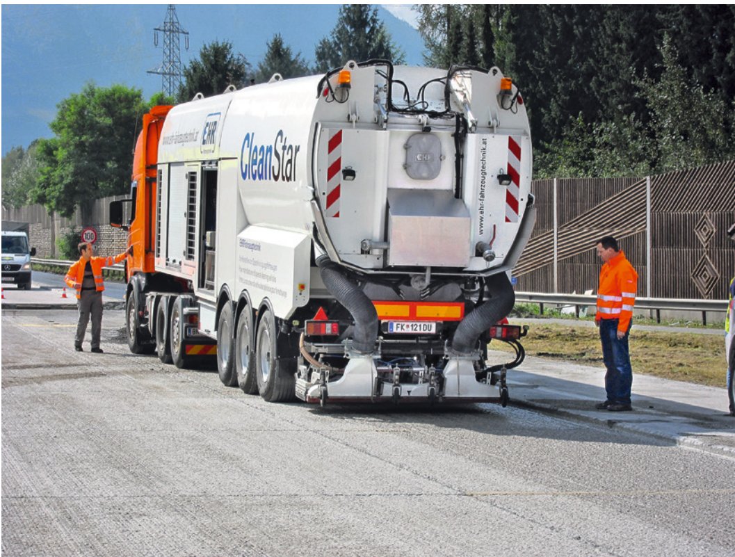
Abb. 6 Reinigung mittels Höchstdruckwasserstrahlen (HDW)