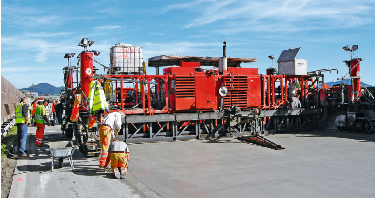
Abb. 7 Betondeckeneinbau bei Tag

der Unterlage mehrere Arbeitsgänge mit dem Höchst- druckwasserstrahlgerät durchzuführen.