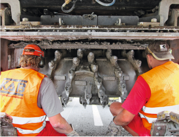
Abb. 2 Fräskopftausch bei der Fräse, Arbeitsbreite 2,2m