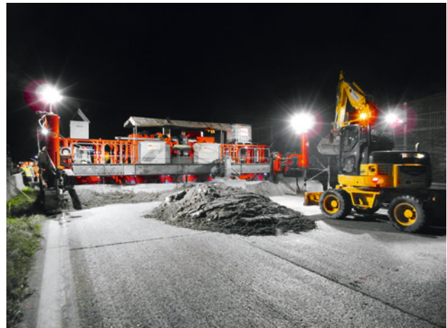
Abb. 8 Betondeckeneinbau bei Nacht

Vor dem Einbau der Oberbetonschicht ist die Be- tonunterlage ausreichend vorzunässen. Mit der Schaf- fung eines ausreichenden Feuchtigkeitsdepots in der Unterlage ist mindestens 12 Stunden vor dem Einbau zu beginnen und das Vornässen bis zum Betondecken- einbau fortzuführen. Die Oberfläche ist durchgehend feucht zu halten. Um dies leichter zu erreichen, wird empfohlen, die Baumaßnahme außerhalb der Sommer- monate, vornehmlich im Herbst durchzuführen.