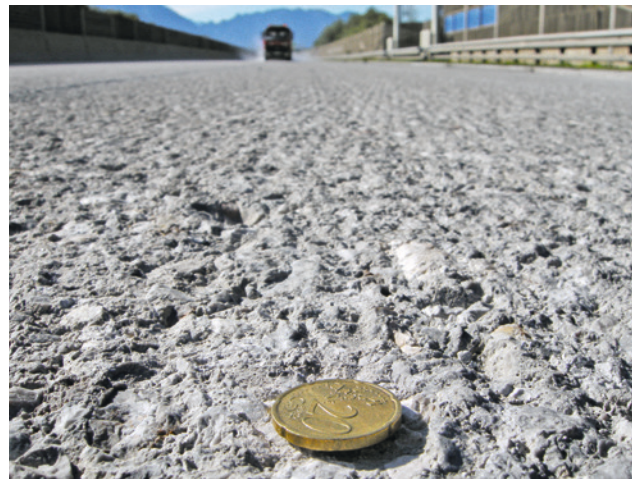
Abb. 5 Oberfläche nach der HDW-Reinigung

Die NÖBI Phase II beinhaltet den Einbau des neuen Oberbetons. Um einen ordnungsgemäßen Haftverbund der neuen Oberbetonschicht mit dem Altbeton der Unterlage zu erhalten, muss die nach den Fräsarbeiten im Mikrogefüge geschädigte Betonoberfläche mittels Höchstdruckwasserstrahlen (HDW > 1.500 bar) vorbehandelt werden. Hierbei sind Systeme einzusetzen, welche Absaugvorrichtungen für das Abtragsmaterial bzw. das Arbeitswasser besitzen und mit einem Rückgewinnungssystem ausgestattet sind. An der Altbetonunterlage ist eine Abreißfestigkeit von \geq 1,5 MPa nachzuweisen. Falls erforderlich, sind zum Erreichen der geforderten Oberflächenfestigkeit