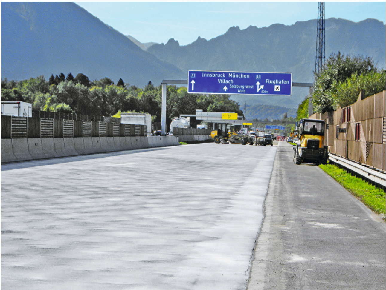
Abb. 9 Fertig sanierte Betondecke

Nach dem Einbau der Betondecke ist eine entsprechende Waschbetondecke herzustellen. Die Längs- und Quertiefen sind gemäß dem Bestand wieder auszubilden. Die Nachbehandlung ist ohne Änderungen gemäß RVS 08.17.02 durchzuführen. Eine Verkehrsfreigabe sollte frühestens fünf Tage nach Ende der Betonierarbeiten erfolgen.