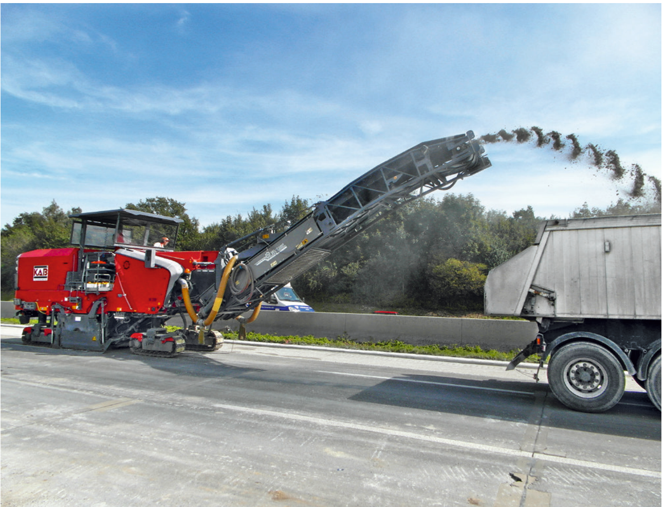
Abb. 4 Fräsabtrag 8 cm