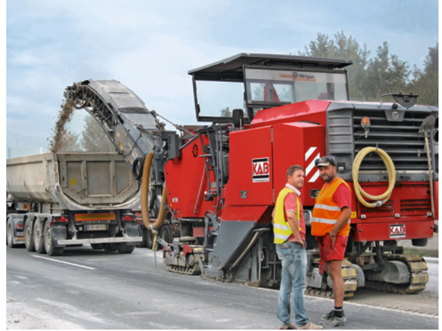
Abb. 3 Fräsabtrag 8 cm