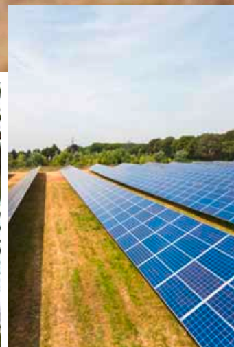
Mit einem Abzweig könnte der ENNI Solarpark direkt an die NiederRheinroute angebunden werden.