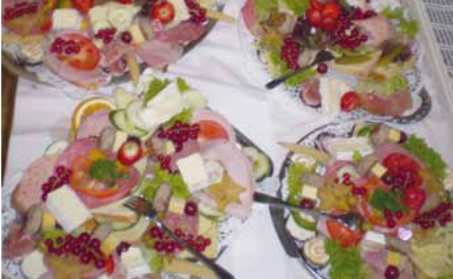
Frisch zubereitete Canapés liebevoll dekoriert

Warum nicht zusammen gehen? Gesagt getan.