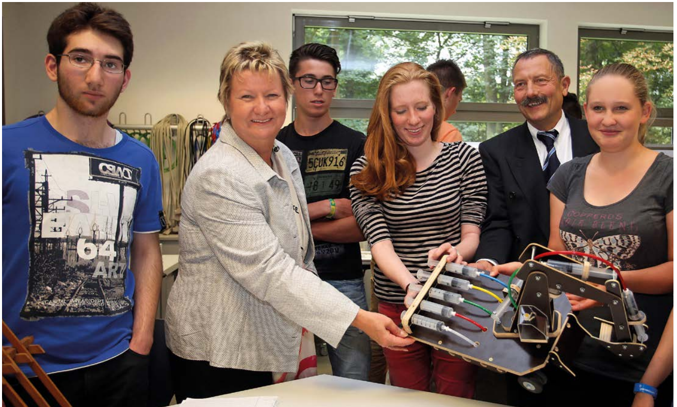
Sylvia Löhrmann, Ministerin für Schule und Weiterbildung des Landes Nordrhein-Westfalen