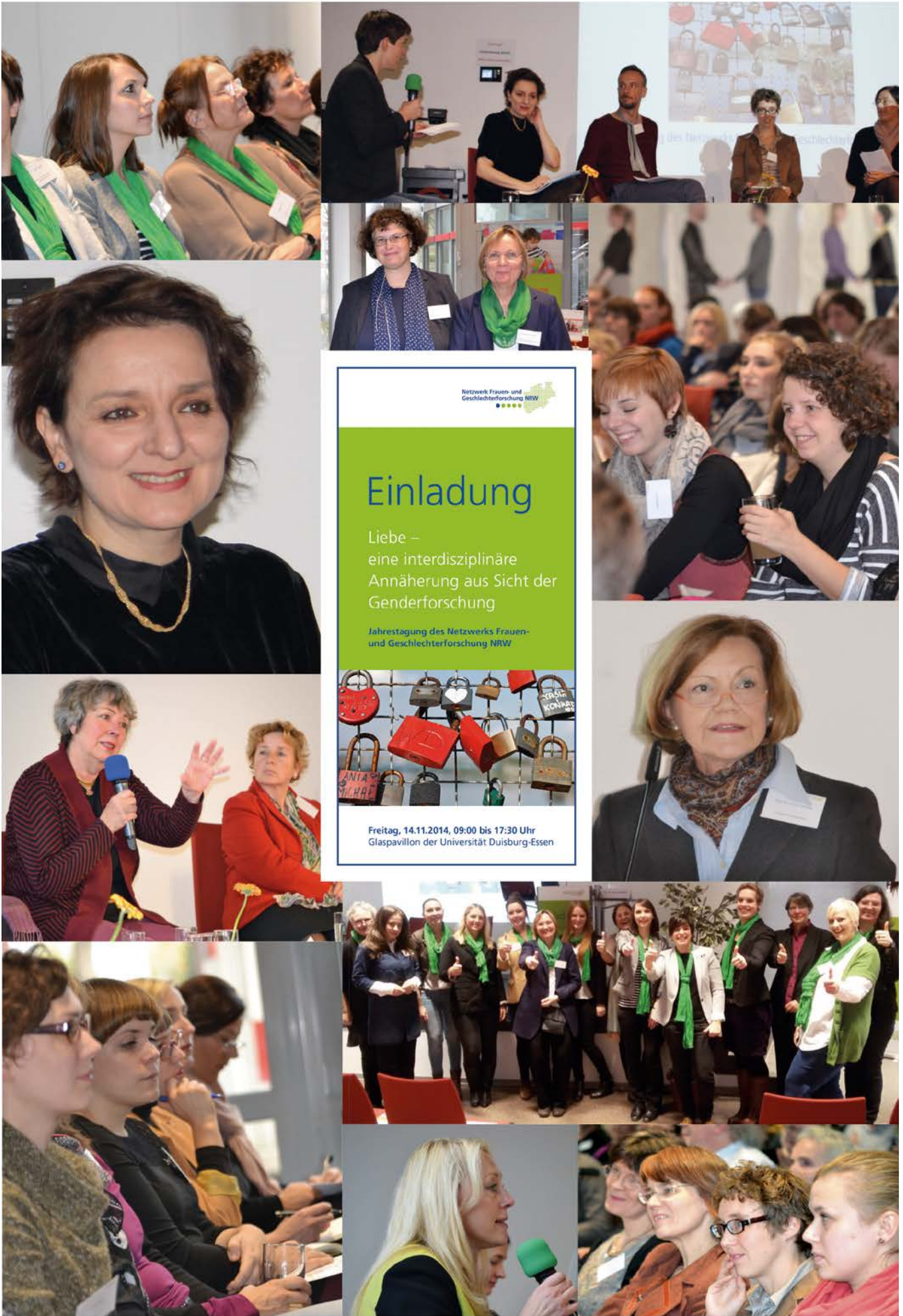
IMPRESSIONEN VON DER JAHRESTAGUNG