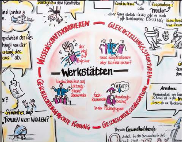
IMPRESSIONEN VOM GENDER-KONGRESS