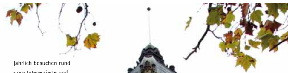
Jährlich besuchen rund 4.000 Interessierte und Fachleute die int.A in der Historischen Stadthalle in Wuppertal

Ende Oktober haben rund 260 Vertreterinnen und Vertreter aus der Bergischen Wirtschaft das Business Breakfast in der Stadthalle besucht, zu dem das Jobcenter Wuppertal, der Quallianz e.V. und Wuppertal Aktiv eingeladen hatten. Eingebettet in den Rahmen der int.A, der Messe für berufliche Integration und Arbeit, ging es im Mendelsohnsaal um die zukünftige Gestaltung der Arbeit.