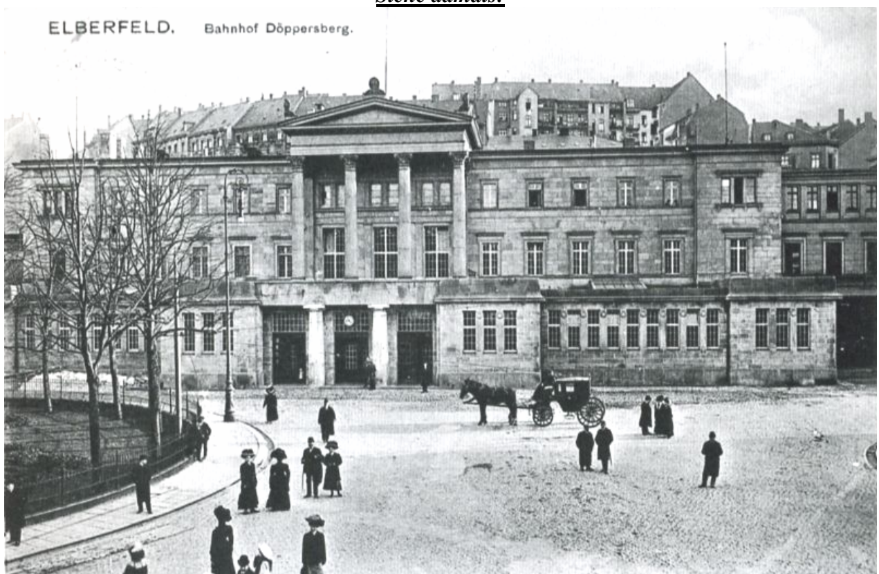
Der Döppersberger Hauptbahnhof nach dem Umbau im Jahre 1908.