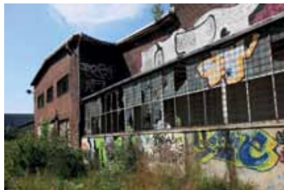
Der Eingang der alten Großviehhalle vor dem Beginn der Bauarbeiten (Aufnahme: 2008)