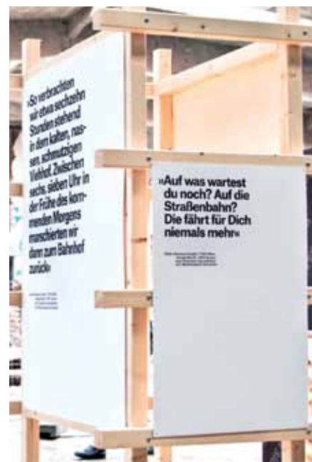
Ausstellung am Tag des offenen Denkmals

Für Anregungen und Kritik sind wir dankbar. Bitte nutzen Sie dafür die im FORENA-FORUM angegebenen Kontaktmöglichkeiten. Vielen Dank!