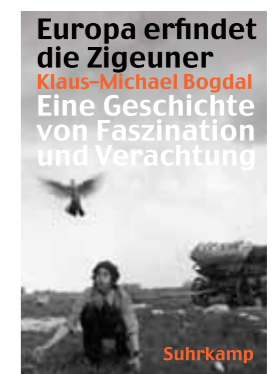
Das Buch zum Vortrag: Klaus-Michael Bogdal: Europa erfindet die Zigeuner - Eine Geschichte von Faszination und Verachtung, Suhrkamp 2013 Ausgezeichnet mit dem Leipziger Buchpreis zur Europäischen Verständigung 2013

e-mail: ADzeladini@dgb-bildungswerk-nrw.de