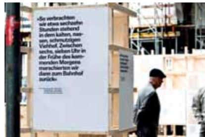
Besucher beim Gang durch die Ausstellung am Tag des offenen Denkmals