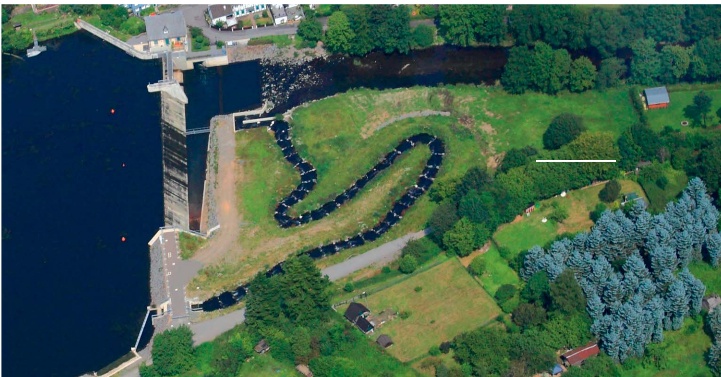
Stausee Beyenburg, Fischaufstieg