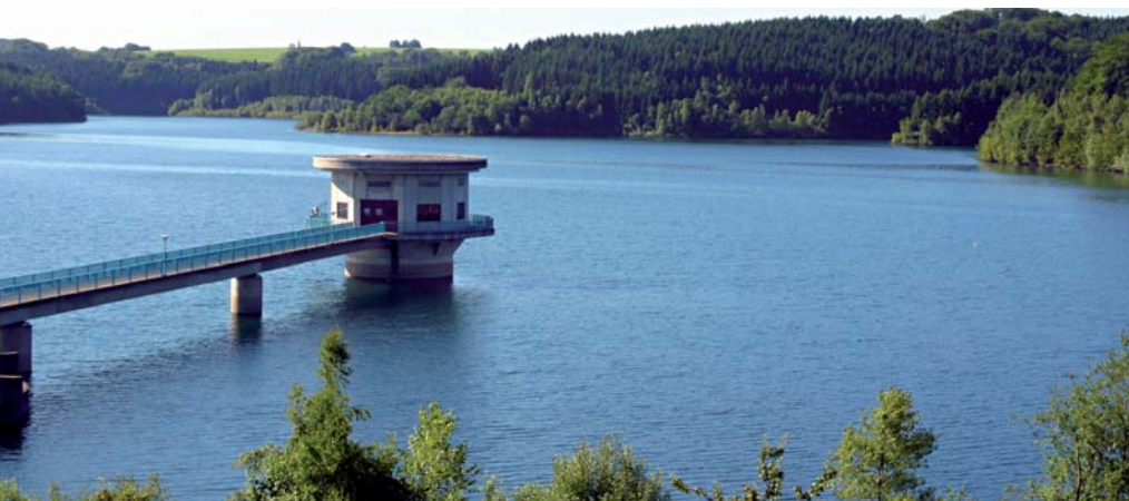
Große Dhünn-Talsperre, Entnahmeturm

Alle Maßnahmen zur Umsetzung der EU-WRRL werden im Flussgebietsmanagement des Wupperverbandes in Verbindung mit weiteren Anforderungen, z. B. aus der Hochwasserrisiko-management-Richtlinie, betrachtet.