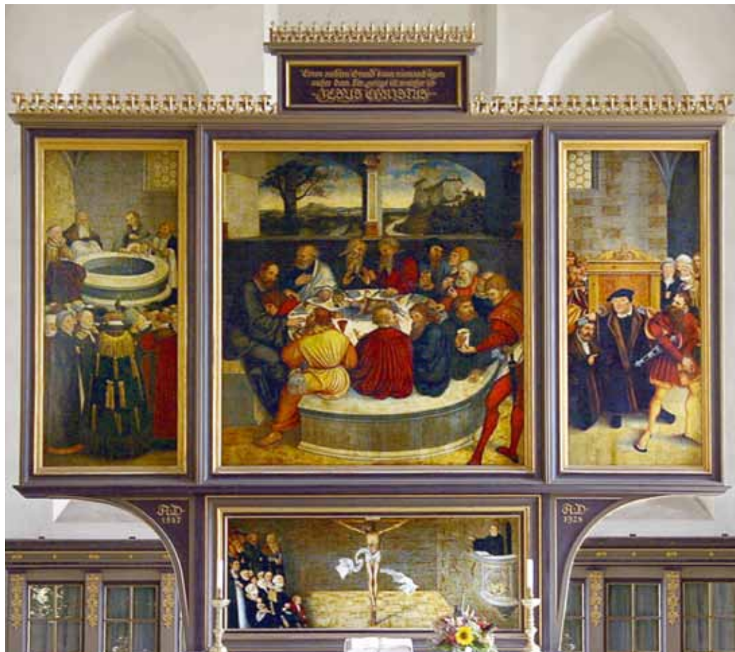
Der Reformationsaltar in der Stadt- und Pfarrkirche St. Marien zu Wittenberg

Eine Arbeitshilfe zum Wittenberger „Reformationsaltar“ von Lucas Cranach dem Älteren im Kontext des christlich-jüdischen Verhältnisses