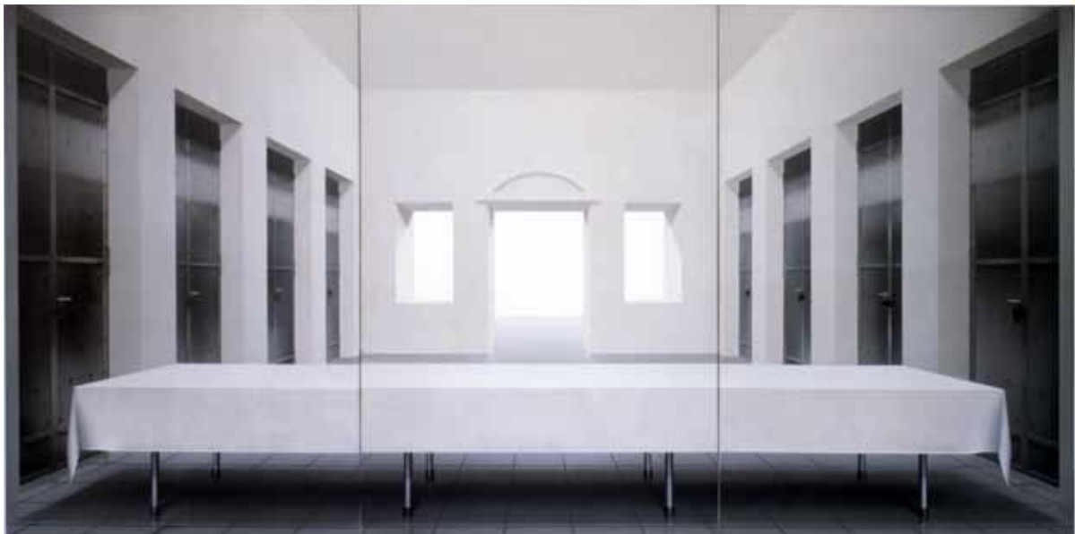
Ben Willikens: Abendmahl, 1976–1979. Triptychon, Acryl auf Leinwand. 300 × 600 cm, Sammlung Deutsches Architekturmuseum DAM