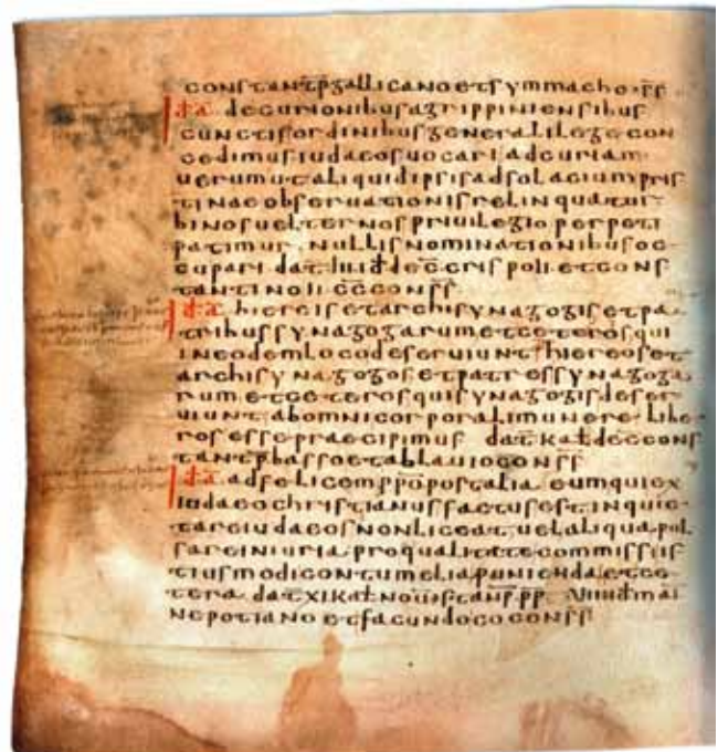
Ein Schreiben Kaiser Konstantins (gest. 334) an die Stadträte von Köln, 321

Auch in den folgenden Jahrhunderten scheint es stets Juden in „Aschkenas“ – also in den deutschsprechenden Ländern Westeuropas gegeben zu haben. Sie gründeten eigene Gemeinden in Orten, die an den großen Wasserstraßen und damit an wichtigen Handelswegen lagen, also z. B. am Rhein und am Main, an Mosel, Donau, Elbe und Saale. Man schätzt, dass am Ende des 11. Jahrhunderts die Zahl der hier wohnenden Juden rund 20.000 bis 25.000 betrug.