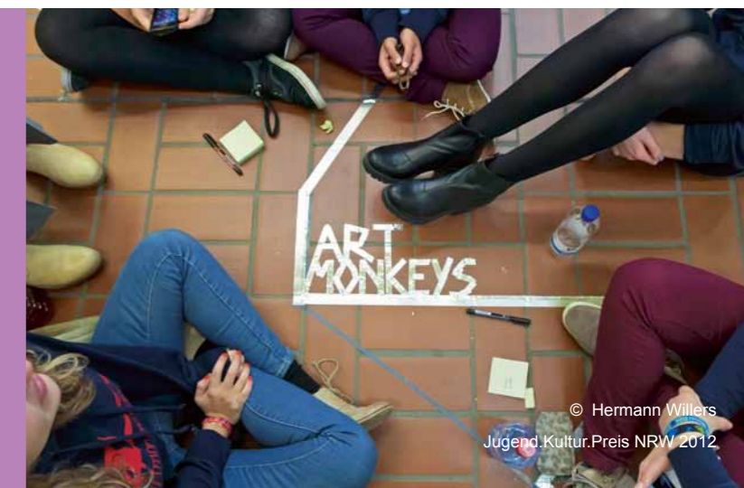
© Hermann Willers Jugend.Kultur.Preis NRW 2012

Für den Online-Award können sich zusätzlich alle Bewerberprojekte im Internet einem öffentlichen Online-Voting stellen. Aktueller Sieger des Publikumspreises war die IBB Media Group des Jugendkulturzentrums (JKZ) Scheune in Ibbenbüren. In dem Videoprojekt ging es um die Frage „Was bedeutet mir das JKZ?“ und um ein medial vermitteltes Bekenntnis zur eigenen Jugendkultur.