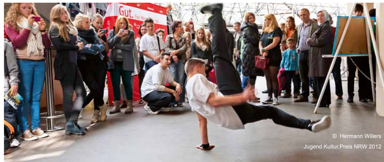
© Hermann Willers Jugend.Kultur.Preis NRW 2012

Die Bewerber für die vier Preiskategorien sind so vielfältig wie die Projekte selbst. Theater, Jugendzentren, Musikschulen, Kindertagesstätten, Soziokulturelle Zentren, Jugendkunstschulen, Museen, Schulen, Stadtteilinitiativen und natürlich Kinder und Jugendliche melden ihre Projekte aus allen künstlerischen Sparten an. Die Preise im Gesamtwert von 15.000 Euro verteilen sich auf vier Kategorien.