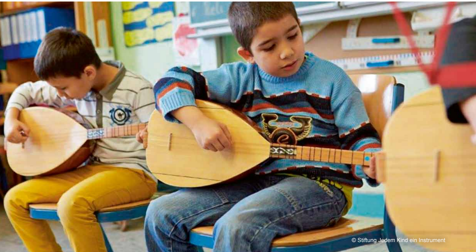
© Stiftung Jedem Kind ein Instrument