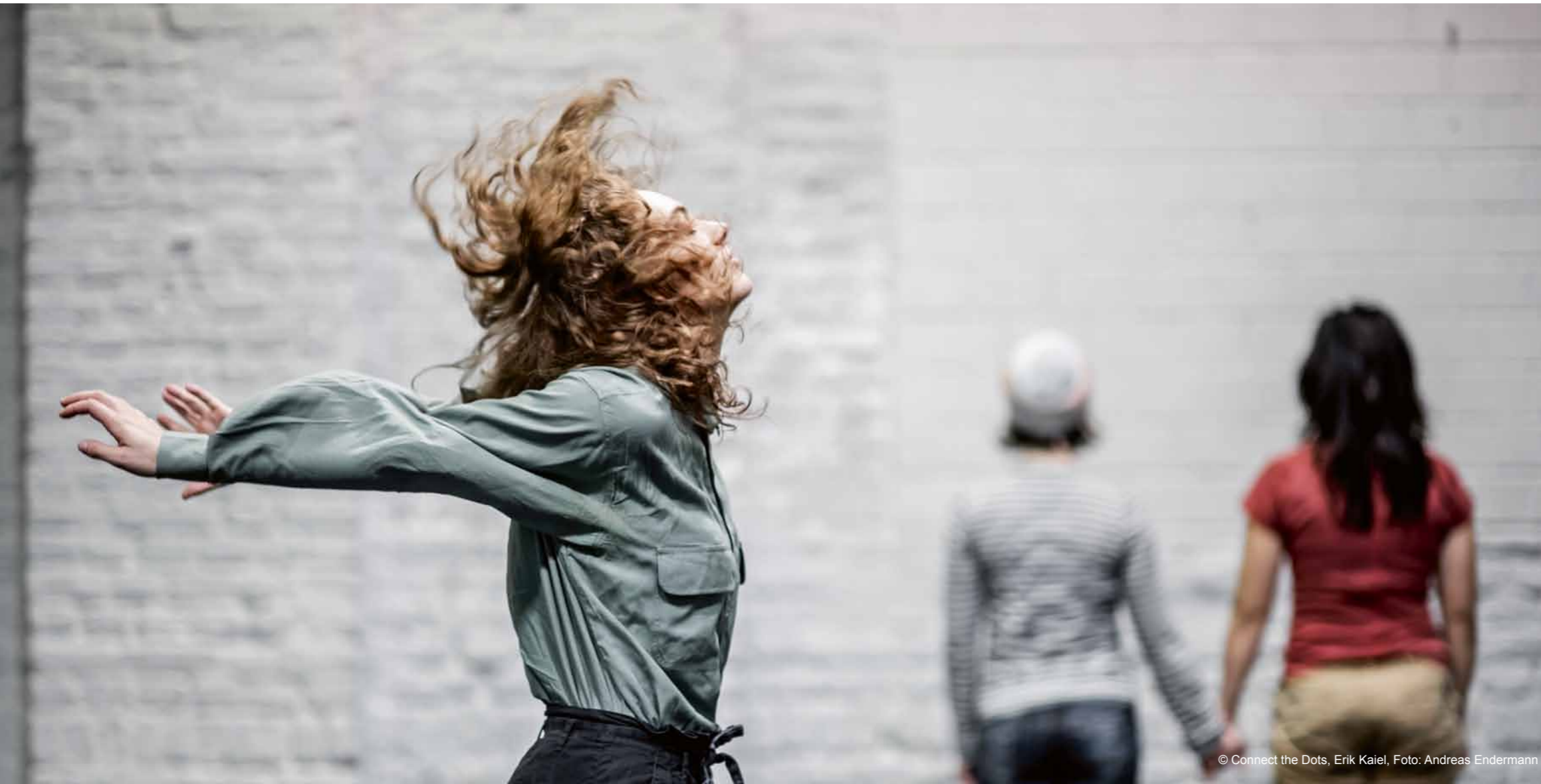
© Connect the Dots, Erik Kaiel, Foto: Andreas Endermann