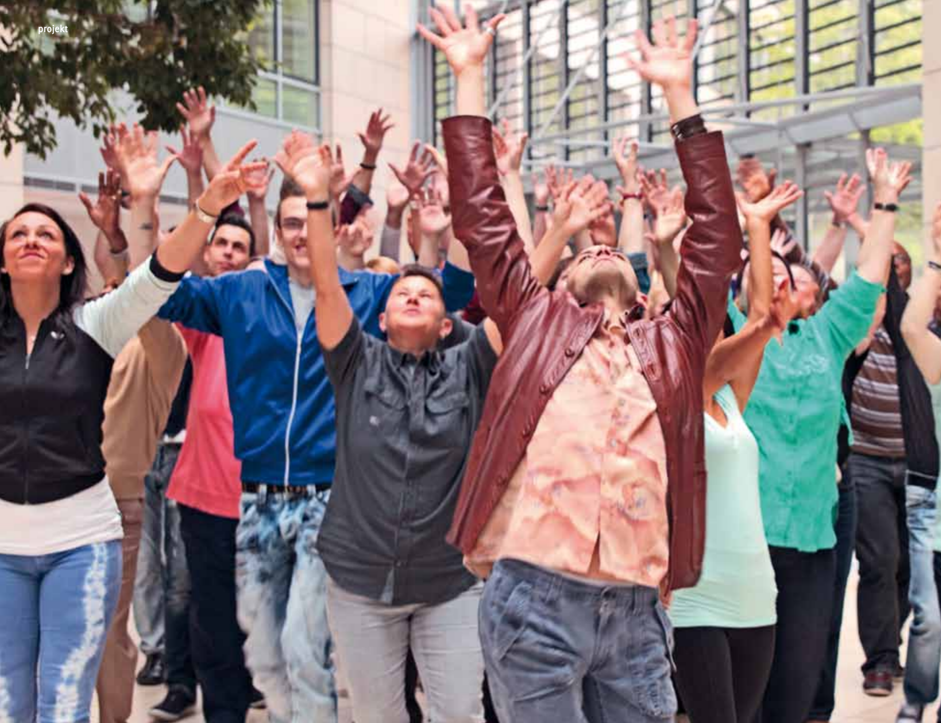
Kundinnen und Kunden des Jobcenters haben als Gruppe an einem Drehtag mitgewirkt.