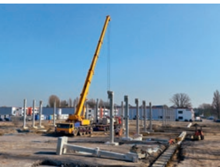
Fujita & Co. ist in den SEGRO Park gezogen, wo man soeben mit den Arbeiten zum 2. Bauabschnitt begonnen hat.

Ein voller Erfolg ist der SEGRO Park Düsseldorf-Süd an der Bonner Straße in Benrath. Nicht nur, dass Phase 1 des Businessparks von der Deutschen Gesellschaft für Nachhaltiges Bauen mit „Silber“ vorzertifiziert wurde, seit Anfang 2014 ist der erste Bauabschnitt auch voll vermietet.