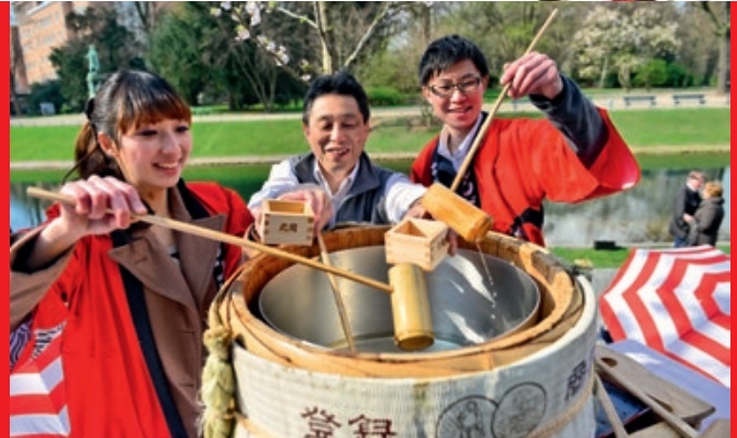
Im Mai feierte die Landeshauptstadt ihr erstes Hanami, das Fest der Kirschblüte, mit der japanischen Gemeinde vor dem Kö-Bogen.

im „Klein-Tokyo am Rhein“ sicher fündig. Mit dieser umfassenden Infrastruktur ist Düsseldorf einmalig in Deutschland und Kontinentaleuropa. Im „Toykio“, einem verrückten Mix aus Spielzeuggeschäft, Kunstgalerie und Kaffeebar, kann man sich ganz wie Scarlett Johansson im Film „Lost in Translation“ fühlen. Sogar die New York Times empfiehlt Touristen den Laden an der Immermannstraße – auch wenn ihn kein japanischer, sondern ein türkischstämmiger Geschäftsmann betreibt. So ist der internationale Wirtschaftsstandort Düsseldorf! Wer aus Japan mit der Familie nach Düsseldorf zieht, muss sich um die Betreuung und Ausbildung der Kinder keine Sorgen machen. Vier japanische Kindergärten gibt es für die Kleinsten, während in der „Japanischen Internationalen Schule“ etwa 500 Kinder der Klassen 1–9 unterrichtet werden. Für Ältere gibt es einen einfachen Übergang in die Internationale Schule. Nicht wenige besuchen allerdings in Düsseldorf auch die Regelschulen – an denen wiederum japanische Sprachkurse keine Seltenheit sind.