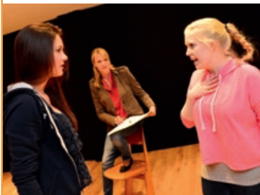
Business meets theatre!

Selbstbewusstsein, Toleranz, Teamwork – das lernt man bei der Schauspielerei. Dinge, die einen auch im Privaten, Schulischen oder Beruflichen weiterbringen.