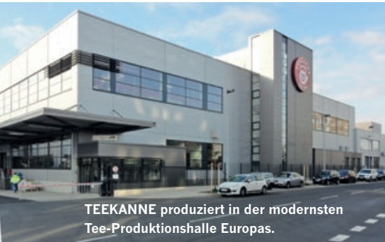
TEEKANNE produziert in der modernsten Tee-Produktionshalle Europas.

Das Düsseldorfer Unternehmen TEEKANNE blickt auf eine über 130-jährige Erfolgsgeschichte zurück: von der Patentierung des Doppelkammerbeutels bis zur Einführung immer neuer Kreationen auf dem Teemarkt. Immer wieder wusste TEEKANNE mit Innovationen zu punkten und zeitgleich seine Traditionen zu bewahren.