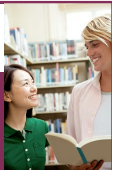
Der Studienfonds fördert interkulturelles Verständnis.

Aus ihren Erträgen werden regelmäßig Studienreisen nach Japan finanziert, mit dem Ziel, das gegenseitige Verständnis zwischen Deutschland und Japan zu fördern. Die Stiftung war ein Geschenk der hiesigen japanischen Gemeinde an die Landeshauptstadt Düsseldorf anlässlich des 700-jährigen Stadtjubiläums im Jahr 1988. Seit ihrer Gründung bietet die Stiftung jungen Fachleuten aus der Region die Möglichkeit, an Studienreisen nach Japan teilzunehmen. Ein Kulturprogramm, zu dem seit Beginn der freundschaftlichen Beziehungen mit der Landeshauptstadt Düsseldorf selbstverständlich auch ein Besuch in der Präfektur Chiba gehört, eröffnet den Stipendiatinnen und Stipendiaten zudem die Möglichkeit, im persönlichen Austausch und im Haus einer japanischen Familie Land und Leute näher kennen zu lernen. Information: Stiftung Studienfonds Düsseldorf-Japan, c/o Wirtschaftsförderungsamt, Benjamin Leonhardt, Telefon: 89-92294, benjamin.leonhardt@duesseldorf.de . Ein Flyer über den Studienfonds kann bestellt werden unter bestellung@mws-dus.de .