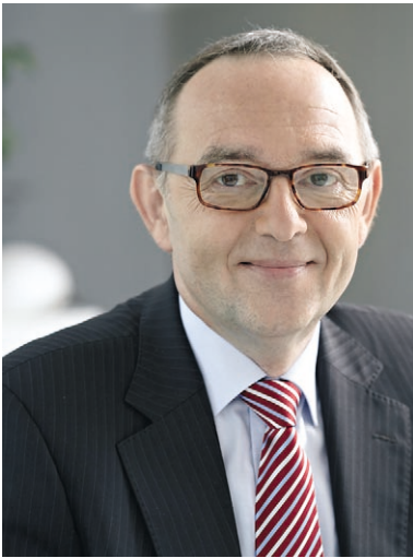
Dr. Norbert Walter-Borjans Finanzminister des Landes Nordrhein-Westfalen