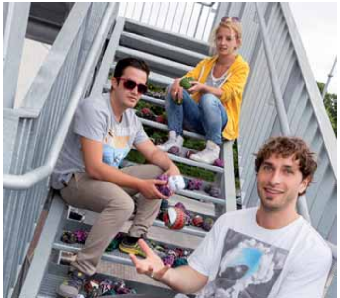
34 Crossboccia - ein bergischer Trendsport erobert die Welt