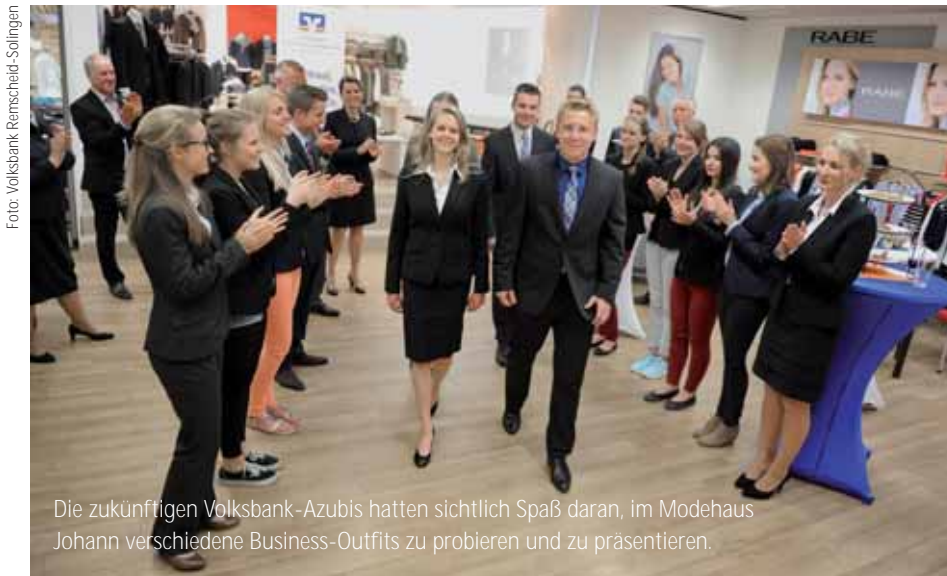
Die zukünftigen Volksbank-Azubis hatten sichtlich Spaß daran, im Modehaus Johann verschiedene Business-Outfits zu probieren und zu präsentieren.