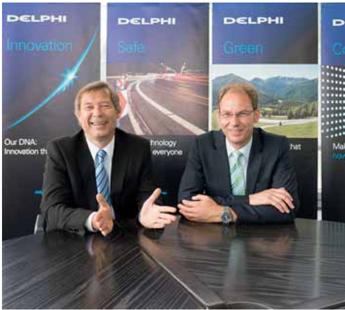
8 Bei Delphi im Bergischen entstehen viele Innovationen mit weltweiter Bedeutung