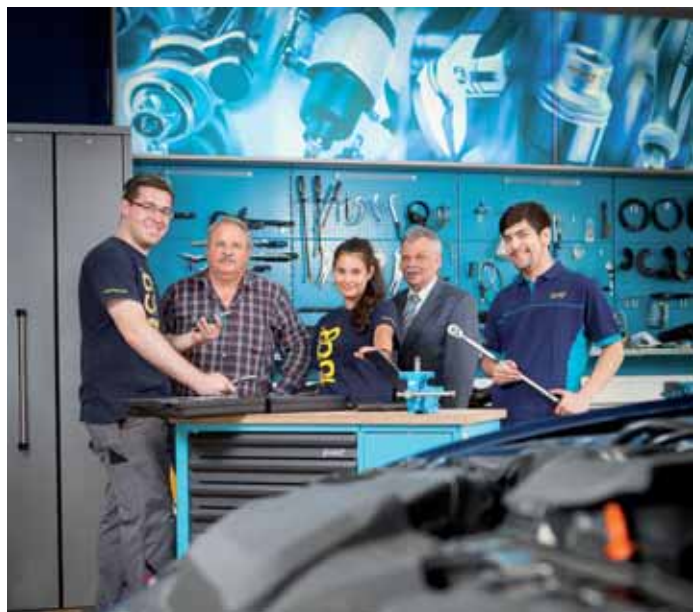
42 Meine Ausbildung: Hazet in Remscheid