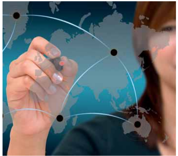
24 Schwerpunkt: Alle Infos zum NRW-Außenwirtschaftstag in Köln