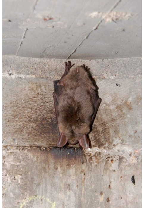
Auch beim Ausbau, der Umnutzung oder dem Abriss von leer stehenden Gebäuden können planungsrelevante Tierarten betroffen sein. Hier ein Exemplar der Fledermausart Großes Mausohr.

Treffen diese Voraussetzungen nicht zu, wird die Bauaufsichtsbehörde die Untere Landschaftsbehörde beteiligen.