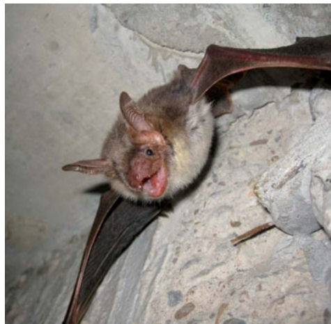
Alle Fledermausarten (hier: hängendes Großes Mausohr) zählen zu den Anhang IV-Arten der FFH-RL und unterliegen damit dem besonderen Artenschutz