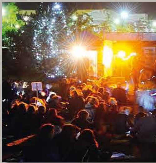
Taschenlampenkonzert Open-Air-Show für Kinder 21. September 2013 Park der Volksbank