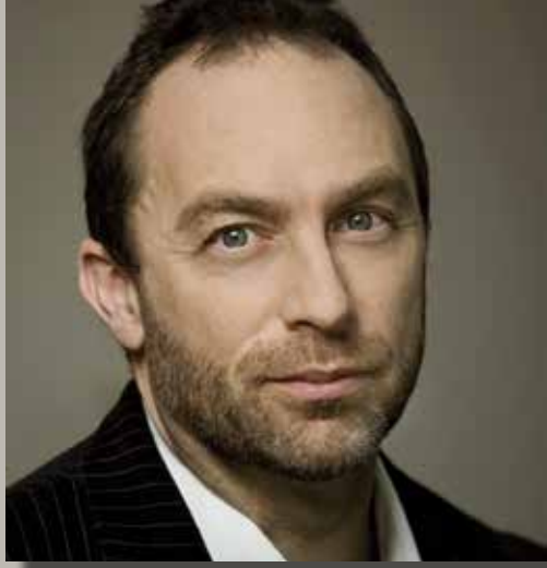
Jimmy Wales Wikipedia-Erfinder 6. März 2013 Kaiser-Friedrich-Halle