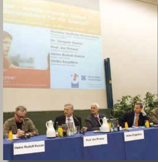
Campusgespräche Thema: „CSR – corporate social responsibility“ 23. Mai 2013, Hochschule Niederrhein