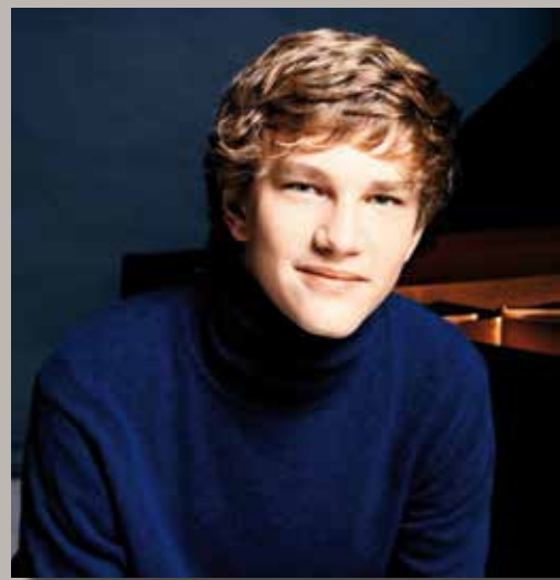
Jan Lisiecki, Pianist 24. September 2013 Kaiser-Friedrich-Halle