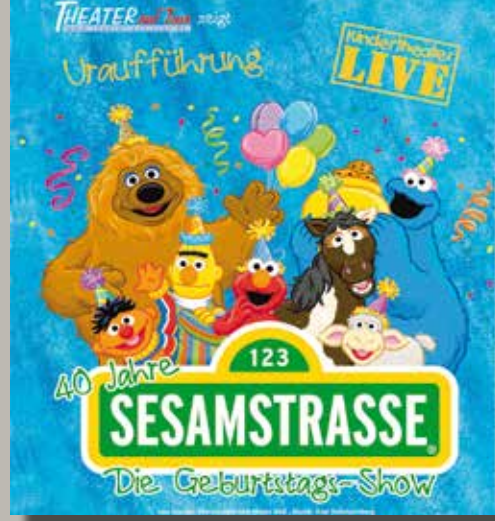
„40 Jahre Sesamstraße – die Geburtstagsshow“ 28. Mai 2013 Kaiser-Friedrich-Halle