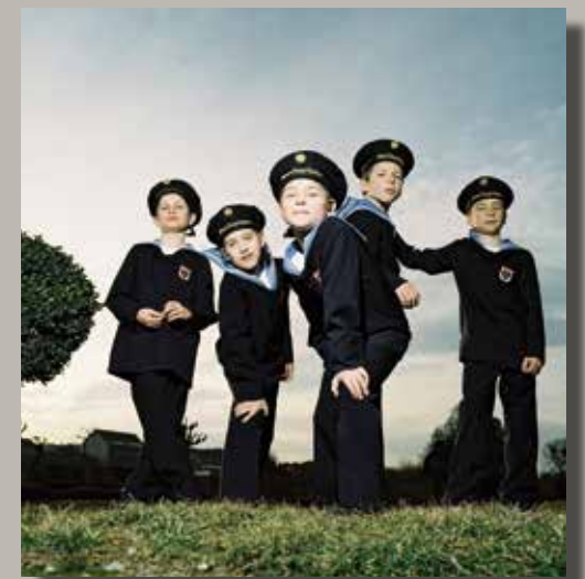
Wiener Sängerknaben 10. Dezember 2013 Ev. Hauptkirche am Rheydter Markt