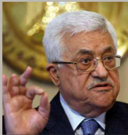
Mahmud Abbas Sonderveranstaltung zum 10-jährigen Jubiläum 18. Oktober 2013, Kaiser-Friedrich-Halle