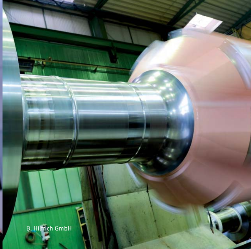
B. Hilfrich GmbH