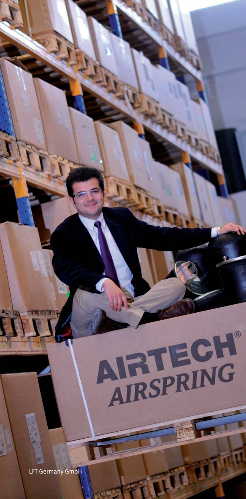
LFT Germany GmbH