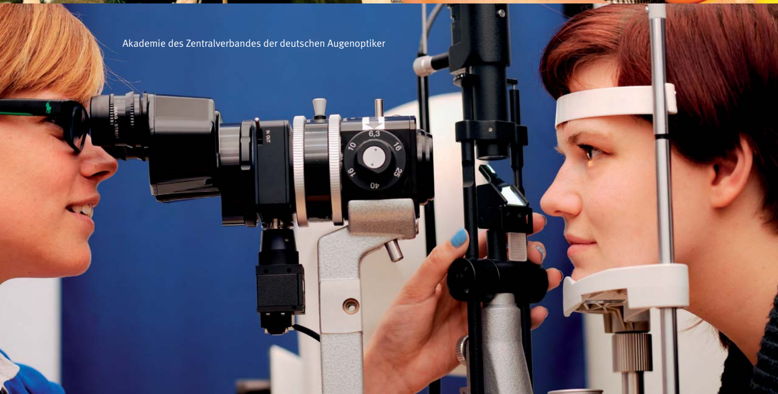
Akademie des Zentralverbandes der deutschen Augenoptiker