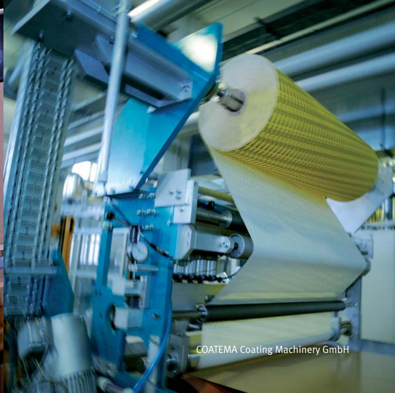
COATEMA Coating Machinery GmbH