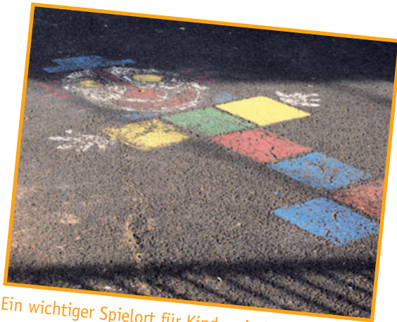
Ein wichtiger Spielort für Kinder sind die Straßen und Plätze vor dem Haus.