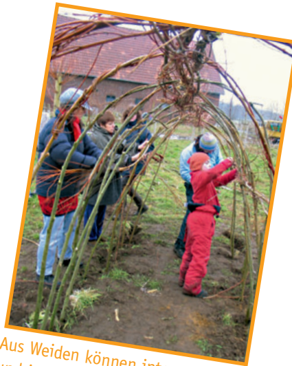
Aus Weiden können interessante und individuelle Spiel- und Ruheräume für Kinder geschaffen werden.