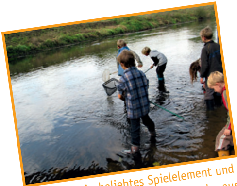
Wasser ist ein beliebtes Spielelement und übt eine starke Faszination auf Kinder aus.