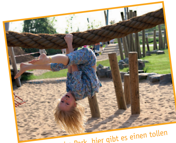
Ich bin gerne im Park, hier gibt es einen tollen Spielplatz und gute Verstecke.