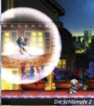
Die Schlümpfe 2