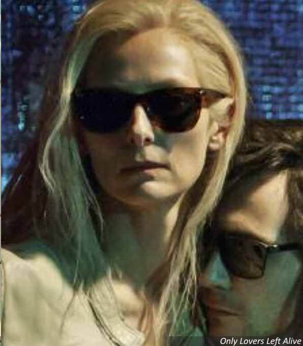
Only Lovers Left Alive