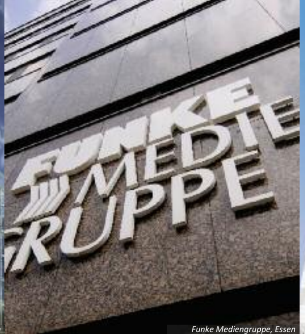
Funke Mediengruppe, Essen