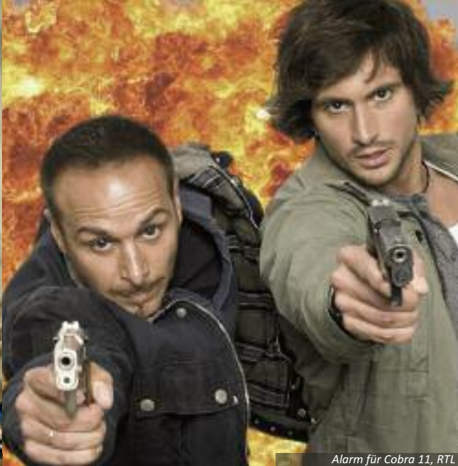
Alarm für Cobra 11, RTL