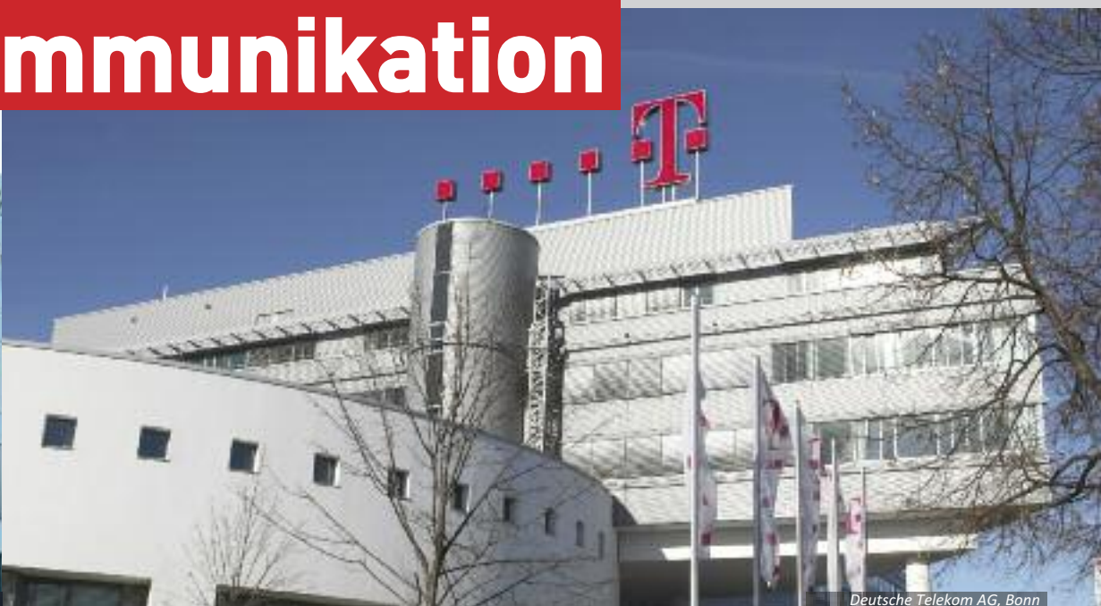
Deutsche Telekom AG, Bonn