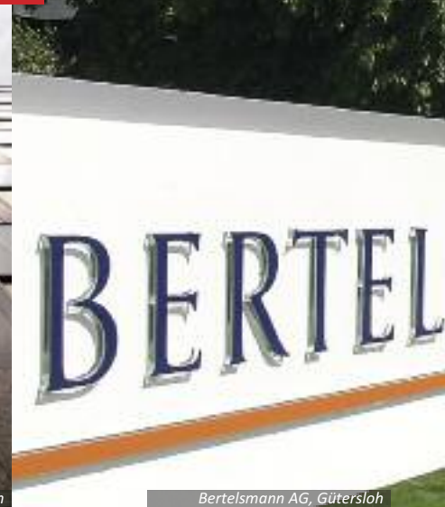
Bertelsmann AG, Gütersloh