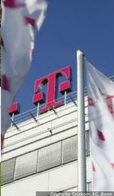
Deutsche Telekom AG, Bonn