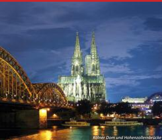
Kölner Dom und Hohenzollernbrücke