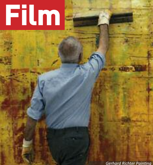
Gerhard Richter Painting