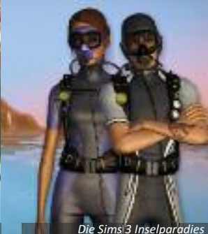
Die Sims 3 Inselparadies