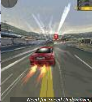
Need for Speed Undercover