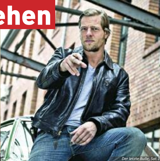
Der letzte Bulle, Sat.1