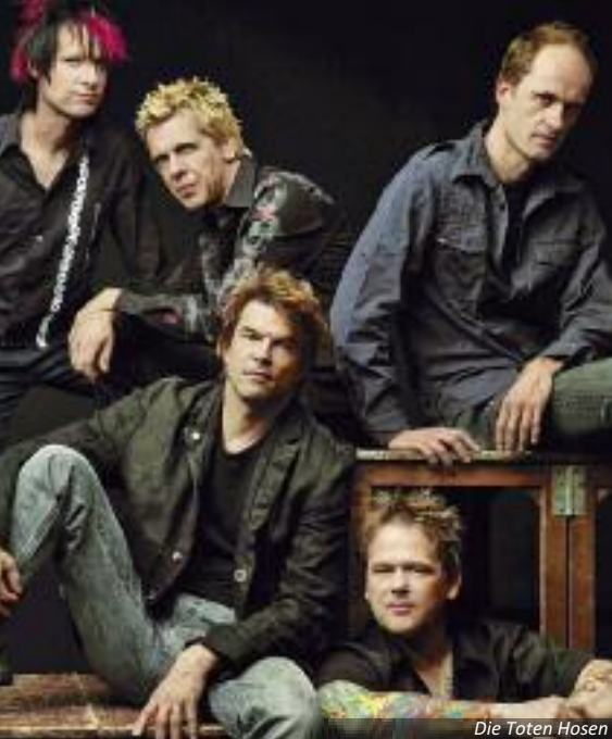
Die Toten Hosen