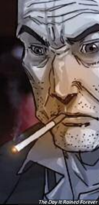
The Day It Rained Forever