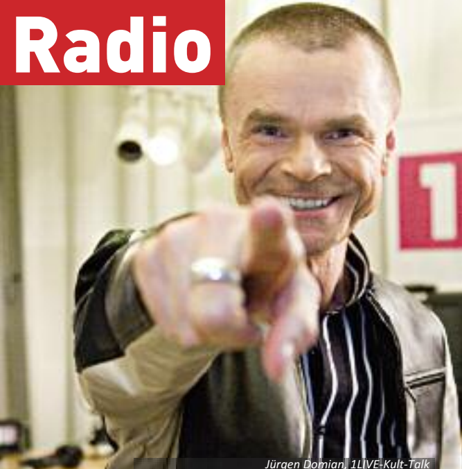
Jürgen Domian, 1LIVE-Kult-Talk