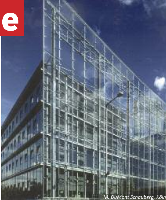
M. DuMont Schauberg, Köln

Aachener Nachrichten Aachener Zeitung Bonner General-Anzeiger Der Patriot Die Glocke Express Handelsblatt Hellweger Anzeiger Iserlohner Kreisanzeiger und Zeitung Kölner Stadt-Anzeiger Kölnische Rundschau Lüdenscheider Nachrichten Mendener Zeitung Mündener Tageblatt Münstersche Zeitung Neue Westfälische Neuß-Grevenbroicher Zeitung NRZ – Neue Ruhr Zeitung Recklinghäuser Zeitung Remscheider General-Anzeiger