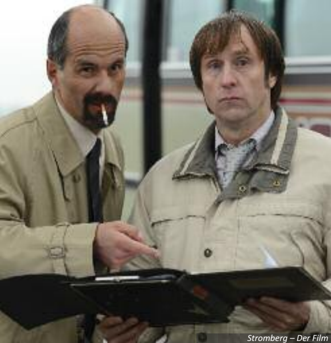
Stromberg – Der Film