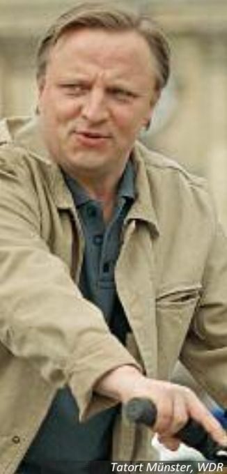
Tatort Münster, WDR