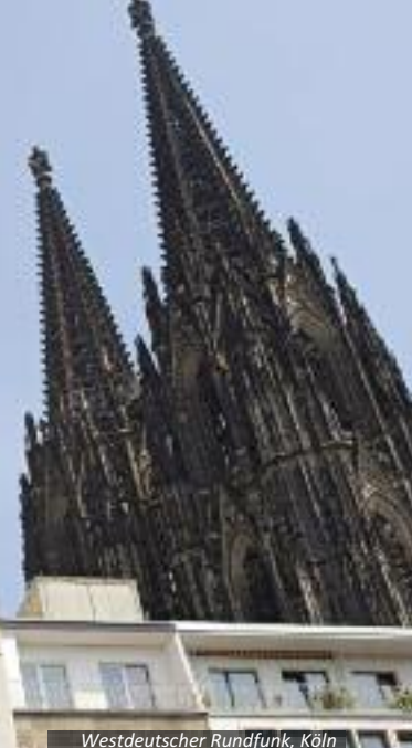
Westdeutscher Rundfunk, Köln

der bundesweit zweitgrößten PR-Agentur (Ketchum Pleon). Agenturen und Kreative schätzen die Internationalität, die großen Konzerne und Medien, die Lebensqualität und das ungezwungene Miteinander von Lifestyle und Business. Zudem liefert das kulturelle Umfeld einen starken kreativen Input.