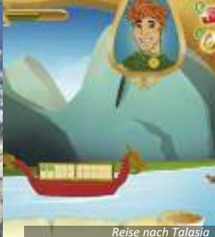
Reise nach Talasia