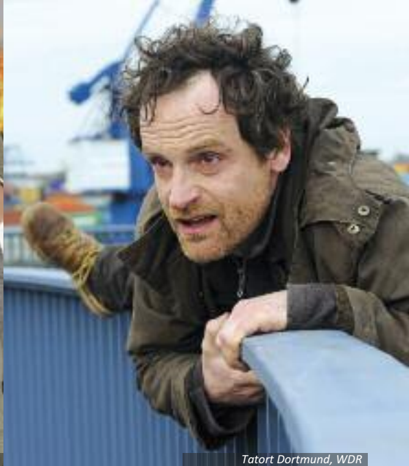
Tatort Dortmund, WDR

Seit fast 30 Jahren prägt die Lindenstraße den deutschen Fernsehsonntag und das Profil der Geißendörfer Film- und Fernsehproduktion KG. Neben der Erfolgsserie entstanden zahlreiche preisgekrönte Filme wie Schneeland und Selbstgespräche , 2013 startete die Verfilmung des Fantasy-Bestsellers Rubinrot erfolgreich im Kino. Tag/Traum in der Kölner City produziert seit dreißig Jahren Dokumentar- und Spielfilme für Kino und Fernsehen. Zu den TV-Highlights gehören Keine Angst und Sommer 1939 . Auch Zieglerfilm Köln steht für zahlreiche TV-Erfolge, u.a. Ein Fall für die Anrheiner und Der Mann mit dem Fagott , der Verfilmung von Udo Jürgens' Lebensgeschichte. Zeitsprung Pictures mit Sitz im Kölner Westen ist im deutschen Fernsehen mit Movies und Serien präsent, zum Beispiel mit Beate Uhse , Contergang und Frau Böhm sagt Nein .