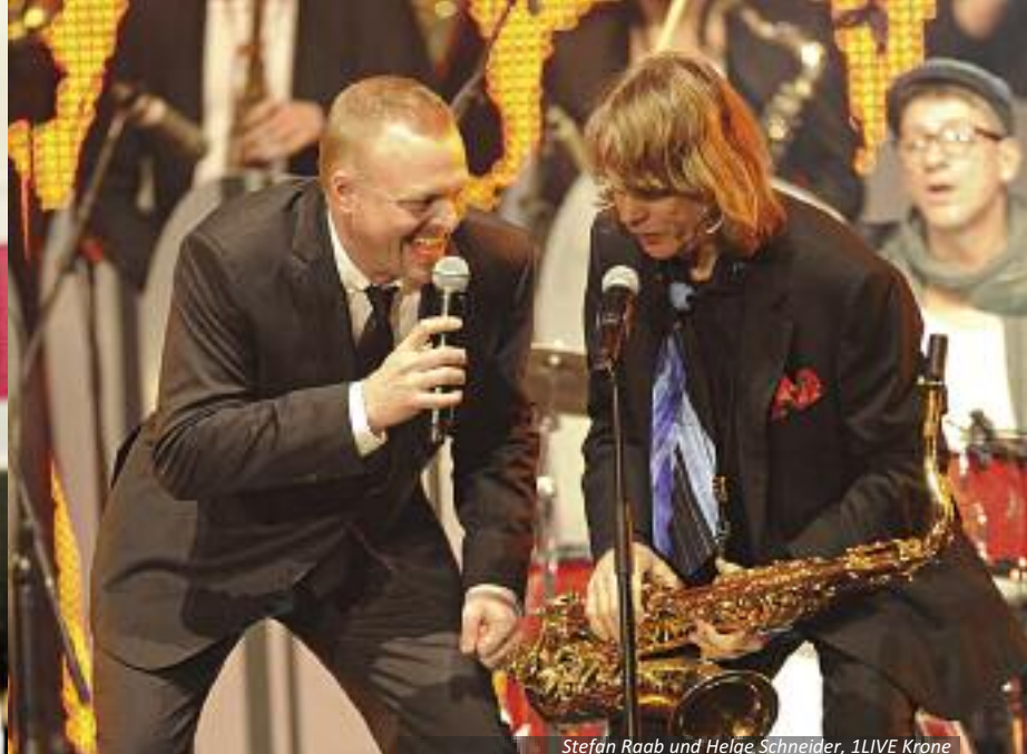
Stefan Raab und Helge Schneider, 1LIVE Krone