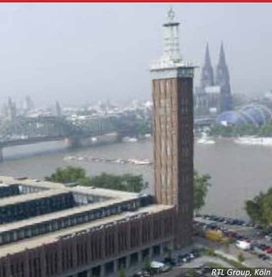
RTL Group, Köln