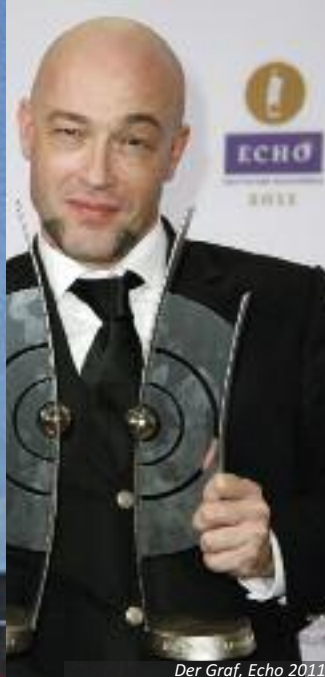
Der Graf, Echo 2011