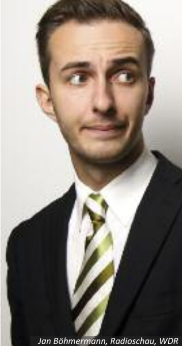
Jan Böhmerrmann, Radioschau, WDR