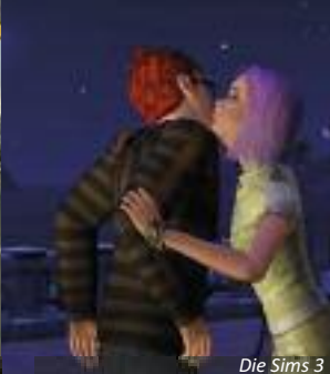
Die Sims 3