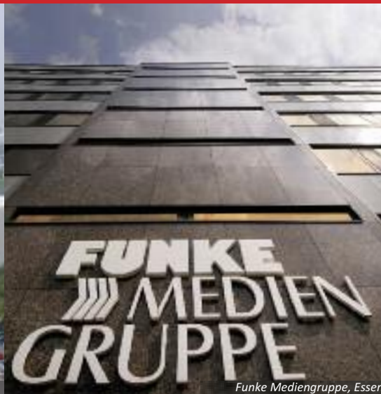
Funke Mediengruppe, Essen