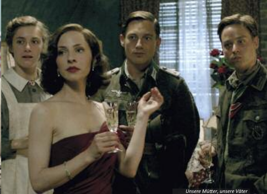
Unsere Mütter, unsere Väter

preis sowie die Förderung von Maßnahmen der Modernisierung, Neuerrichtung und dem Marketing von Filmtheatern: Mit über 800.000 Euro hat die Film- und Medienstiftung NRW die Kinos des Landes allein im Jahr 2012 vielfältig unterstützt. Seit Juni 2012 bietet zudem ein neues Förderprogramm zur Umrüstung kleiner Kinos auf digitale Projektionstechnik für Entlastung der Kinobetreiber, aufgelegt vom Land Nordrhein-Westfalen in Kooperation mit der Film- und Medienstiftung NRW. Die Landesregierung stellt dafür im Rahmen der Initiative Digitales Medienland NRW drei Millionen Euro aus dem Europäischen Fonds für regionale Entwicklung (EFRE) zur Verfügung. Bis Ende 2013 sollen rund 150 Leinwände in Nordrhein-Westfalen im Zuge dieses Programms umgerüstet werden.