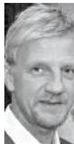
Wim Wenders, Regisseur und Künstler

In den letzten zwanzig Jahren hat sich in NRW eine konkurrenzfähige Film- und Medienwirtschaft mit einem unverwechselbaren Profil entwickelt.