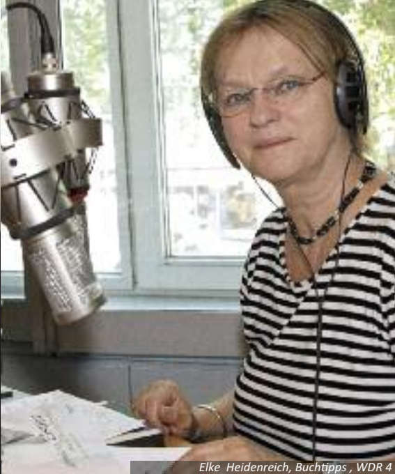
Elke Heidenreich, Buchtipps, WDR 4