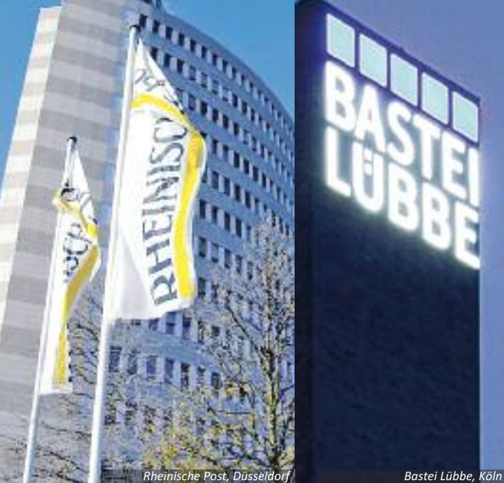
Rheinische Post, Düsseldorf