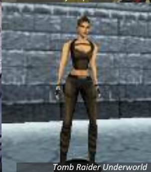
Tomb Raider Underworld