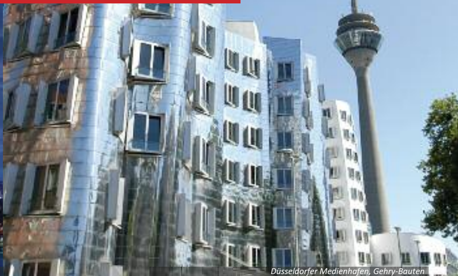
Düsseldorfer Medienhafen, Gehry-Bauten