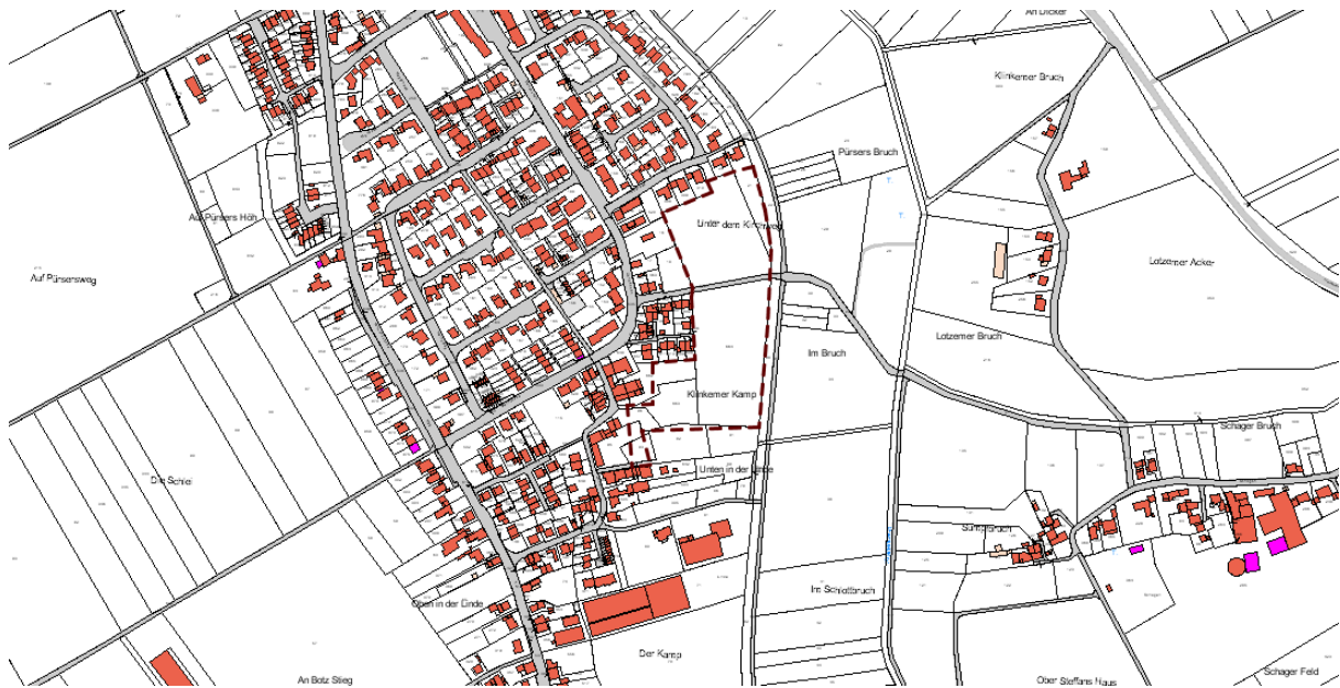
Flächen- nutzungsplan, 2. Änderung