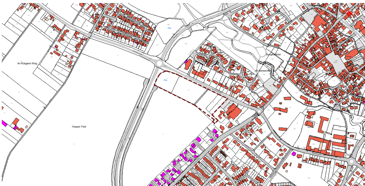
Flächen- nutzungsplan, 2. Änderung