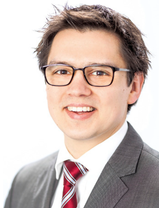
Alexander Vogt MdL ist medienpolitischer Sprecher der SPD-Landtags- fraktion