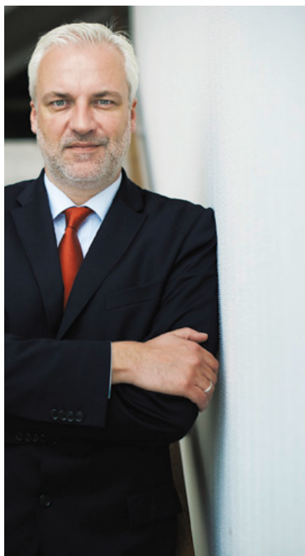
Garrelt Duin ist Minister für Wirtschaft, Energie, Industrie, Mittelstand und Handwerk des Landes Nordrhein-Westfalen