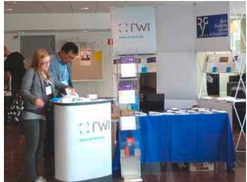
Heja Sverige: Bei der Jahrestagung der European Economic Association (EEA) in Göteborg präsentierte das RWI seine Forschungsergebnisse einem internationalen Publikum.

Informationen: sabine.weiler@rwi-essen.de