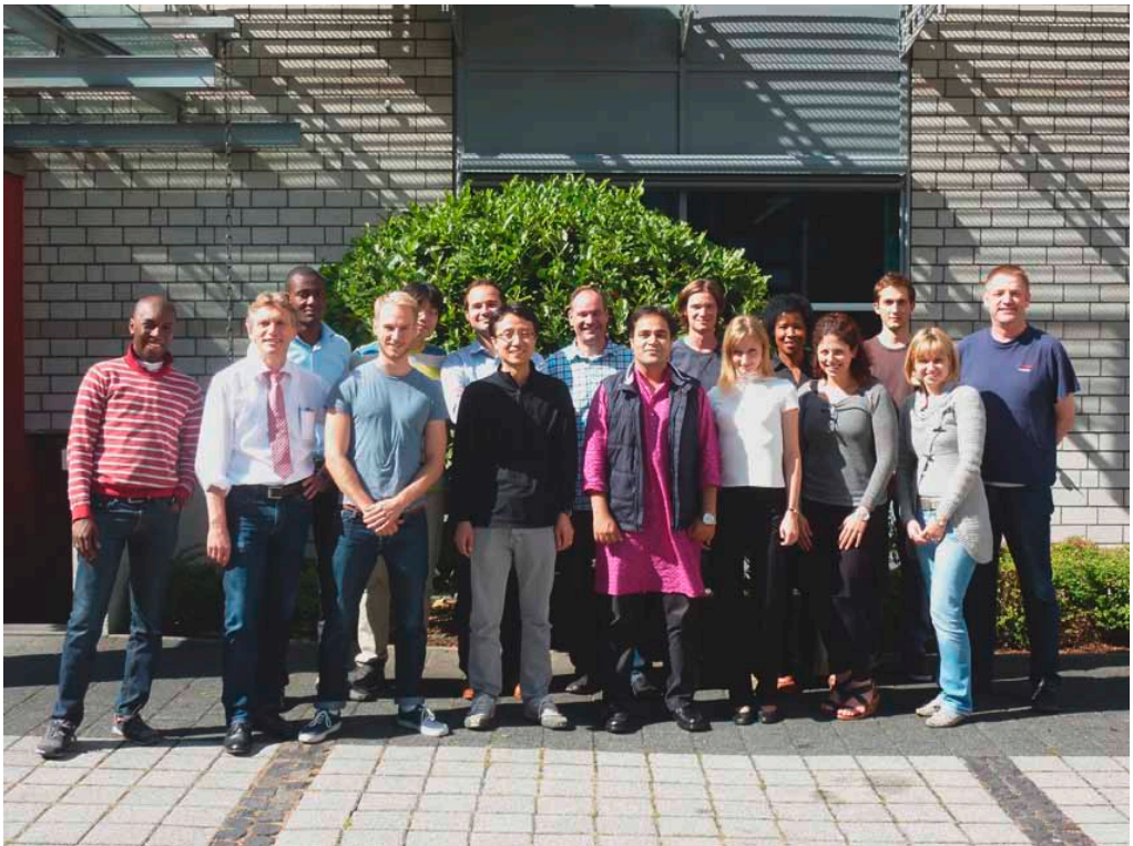
Sommer in Duisburg: Die Teilnehmer der 9. Ruhr Graduate Summer School.

Die Graduate Summer School ist Bestandteil der Ruhr Graduate School in Economics (RGS). Dieses Promotionsprogramm der Volkswirtschaftslehre wird von den Universitäten Bochum, Dortmund und Duisburg-Essen sowie dem Rheinisch-Westfälischen Institut für Wirtschaftsforschung (RWI) gemeinsam getragen.