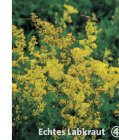
Echtes Labkraut ④