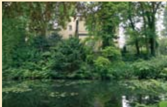
12 Schlosspark Eller