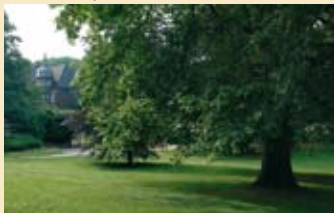
13 Schlosspark Elbroich