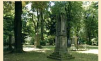
6 Golzheimer Friedhof