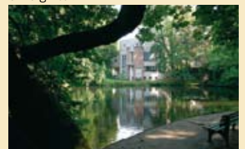
9 Spee'scher Graben