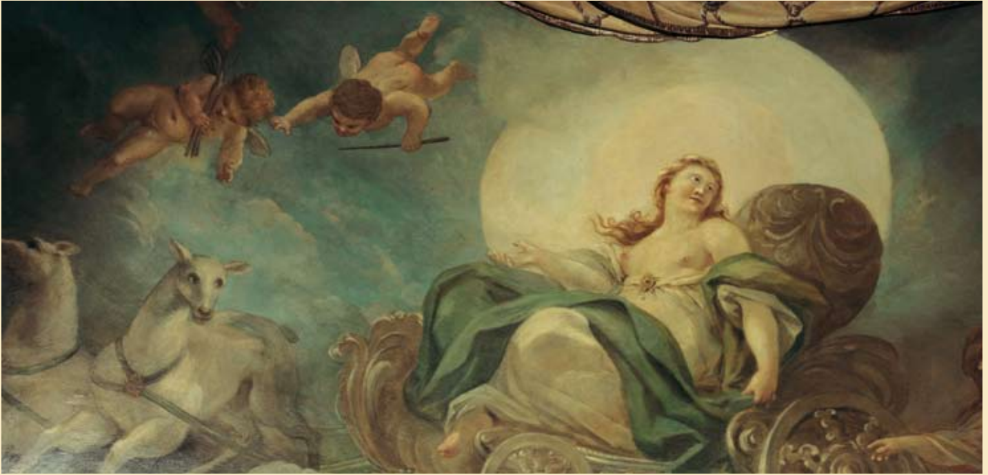
D Schloss Burg an der Wupper