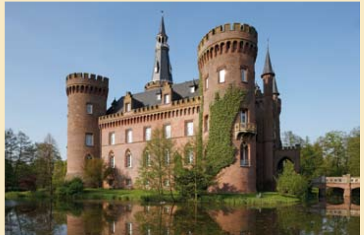
A Schloss Moyland

Das Schloss wurde durch seine Um- gestaltung im 19. Jahrhundert zu einem der wichtigsten neogotischen Schlossbauten in Nordrhein-Westfa- len. Das Museum Schloss Moyland beinhaltet die einstige Privatsamm- lung der Brüder van der Grinten. Sie wird in der historischen Schloss- und Gartenanlage von Schloss Moyland bewahrt und präsentiert. Das Herz- stück der Sammlung ist der weltweit größte Komplex an Arbeiten des Künstlers Joseph Beuys. Zusammen mit den archivalischen Beständen des Joseph Beuys Archivs bilden sie das Beuys-Zentrum. Darüber hinaus bietet das Museum seinen Besuchern ein vielfältiges Ausstellungs-, Ver- mittlungs- und Veranstaltungs- anbot.