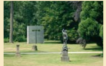
4 Lantz'scher Park