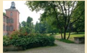
2 Schlosspark Kalkum