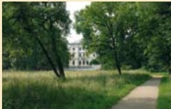
14 Schlosspark Mickeln