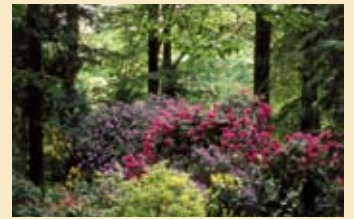
1 Schlosspark Heltorf