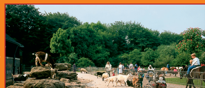
Streichelzoo am Mattlerhof

Die natürlichen Quellen des Holtener Mühlenbachs sind durch den Bergbau versiegt. Anfang 2003 verschwand daher die bisherige Abwasserrinne in Form eines Abwasserkanals unter der Erde und machte Platz für eine neue Grünverbindung. Fußgänger und Radfahrer können nun den neuen Naturraum nutzen.