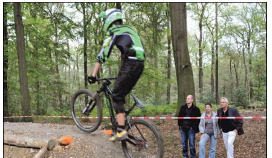
Downhill-Strecke Kothener Wald

BÜNDNIS 90 DIE GRÜNEN KREISVERBAND WUPPERTAL WWW.GRUENE-KVWUPPERTAL.DE