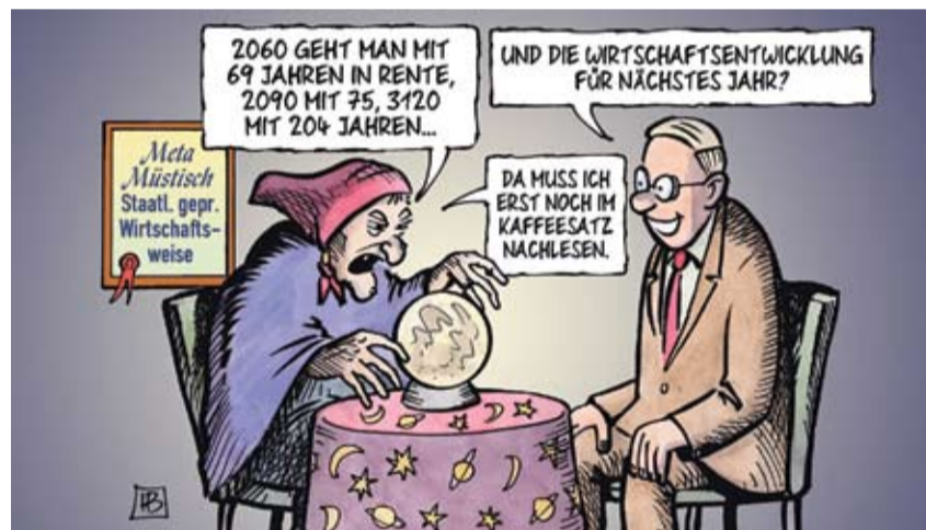
Cartoon: Harm Bengen

ser Kampagne beteiligen würden. Die SPD winkte ab, weil sie grundsätzliche Einwände gegen derartige Zweckbindungen von Geldern hat und stellte damit unter Beweis, dass sie den Sinn der Aktion nicht verstanden hat, denn das Zentrum der Kampagne ist die Verringerung von Armut. Die SPD stellte nun einen eigenen Antrag ohne die Forderung und verfehlte damit komplett den ursprünglichen Zweck der Resolution, auch der Sinn der Beteiligung an einer bundesweiten Kampagne wurde von der SPD nicht wirklich verstanden. Die Linke andererseits übernahm die ursprüngliche Fassung des Jesuitenpaters. Raten Sie mal, welcher Antrag die Mehrheit bekommen hat. Ein Tip: es war nicht der vollständige ... Weitere Informationen über die Kampagne, die Sie auch persönlich online unterschreiben können, gibt es unter www.steuer-gegen-armut.org .