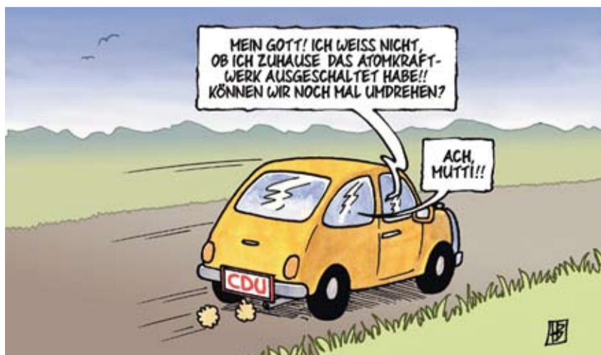
Cartoon: Harm Bengen

Die GRÜNE Fraktion hat bei der Veranstaltung eine ganze Menge an Anregungen erhalten. Nun werden die Ergebnisse ausgewertet und daraus Initiativen für die städtischen Gremien entwickelt.