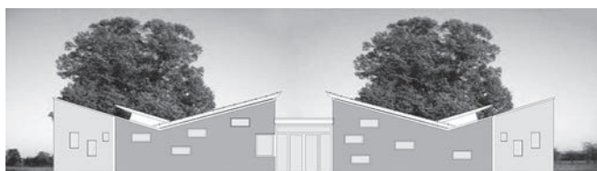
Die Grafik des Architekten zeigt die Ansicht der Kita Feldstraße nach der Erweiterung.

Die Raumkonfigurationen der bestehenden Pultdachkonstruktionen sind Grundlage der Gestaltung des Neubaus. Die neue Gruppe und der Mehrzweckraum werden mit gegenläufigen Pultdächern überdacht, die zu den Fensterbereichen und Zugängen zum Außenbereich ansteigen. Der Erschließungsflur ist analog zum Bestand mit einem Flachdach ausgestattet. Die niedrigere Raumhöhe in diesem Bereich wird übernommen, um die Spannung beim Betreten der Gruppenräume zu steigern, die mit einer wesentlich höheren Raumhöhe konstruiert sind.