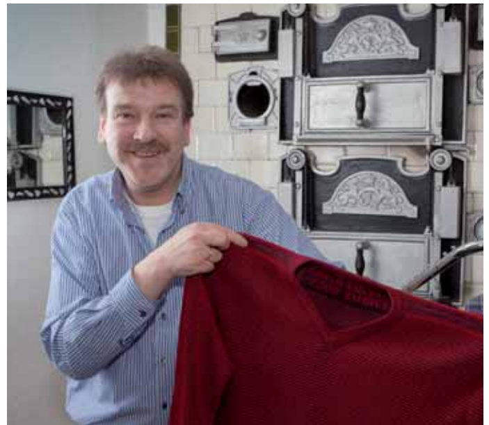
40 Idylle in Wuppertal-Cronenberg