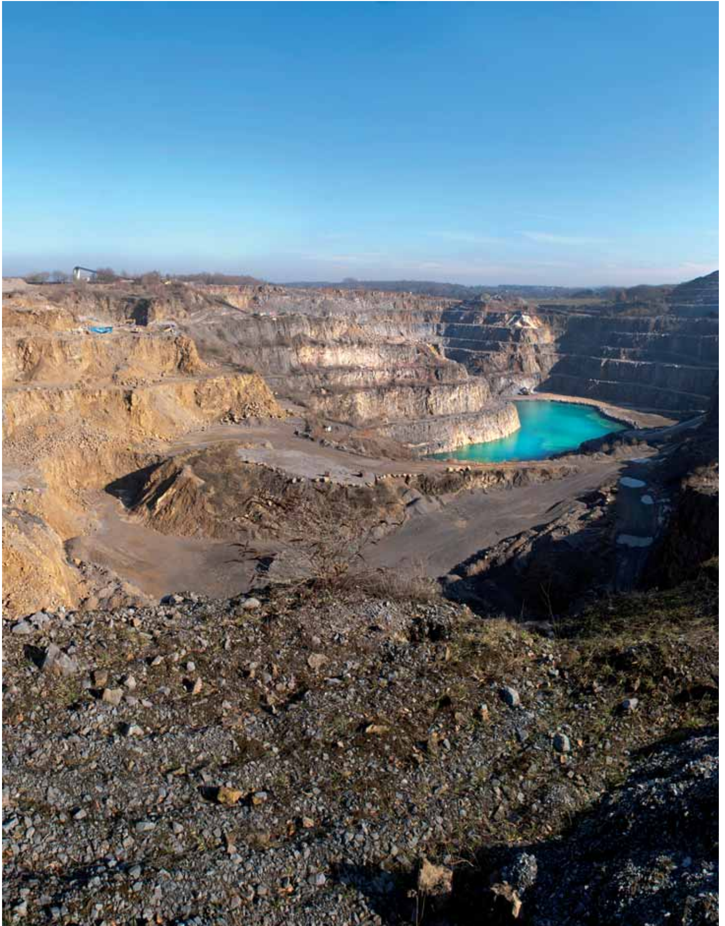
Steinbruch in Wuppertal-Schöller.