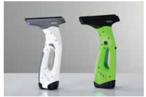
Fenstersauger „Window Vac WV 75 plus“*

Museum und Aktion „Plagiarius“ möchten die Industrie ermutigen, konsequent Schutzrechte für ihre Waren zu beantragen. Ein Appell richtet sich genauso an