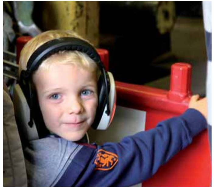
26 Industrie - Image und Akzeptanz