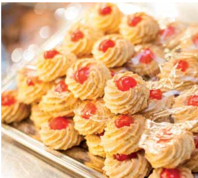
34 Paradies für Süßigkeitenfans: Dolce & Falcone