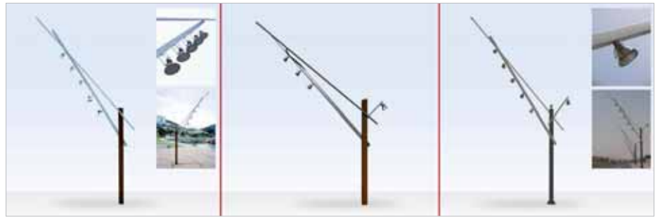
1. Preis (für Anstiftung): Straßenlampe „Latina“ (installiert auf der „Al Waab Street“, Doha, Katar)*

Wer in Solingen durchs Museum schlendert, wird sowohl über die Vielzahl der plagierten Waren als auch über die erstaunliche Chuzpe, mit der Produkte äußerlich beinahe eins zu eins kopiert werden, erstaunt sein. Egal, in welchem Preissegment – nachgemacht wird alles: Vom Papiertaschentuch über Spülbürsten, Kniebandagen, Flaschenöffner, Kinderspielzeug, Kochtöpfen, Thermo- und Isolierkannen, Duscharmaturen bis hin zu Kettensäge und Motorrad reicht die Palette. Und die imitierten Qualitätswaren der bergischen Produzenten durchziehen die Ausstellung wie ein roter Faden: Bestecke, Messer, Scheren, Werkzeug – vor dem Städtedrei-