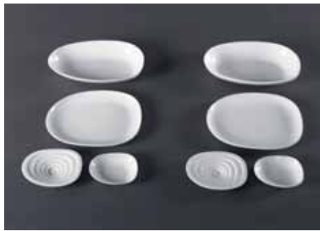
2. Preis: Porzellan-Serie „isola“ (4 Teile)*

Die bergische Wirtschaft mit ihrem hohen technischen Know-how und ihren qualitativ hochwertigen Produkten kennt den Ideenklau nur zu gut und schon sehr viel länger, als ihm ein gerüttelt Maß an medialer Aufmerksamkeit geschenkt wird. In Zeiten der Globalisierung haben die Versuche, Qualitätswaren, Markenzeichen und Designs nachzuahmen aber generell mehr neuen Schwung erhalten. Dies stellen nicht zuletzt die Initiatoren und Mitarbeitenden des Solinger Museums „Plagiarius“ fest. „Durch Internet und Globalisierung hat sich das Problem der Produkt- und Markenpiraterie explosionsartig ausgeweitet“, kann der Besucher dort auf einer Schautafel lesen. Was vor über 30 Jahren als laienhafte Kopiersversuche in Hinterhof-