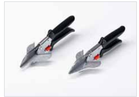
3. Preis: Gehrungsschere (mit 45° Anschlägen)*

Konsumenten bei Salatschleuder oder Kehrblech mit minderer Qualität und kurzer Haltbarkeit abfinden müssen, birgt die Nutzung von Plagiaten etwa bei Schneidwaren, Kettensägen oder elektronischen Geräten ein Verletzungsrisiko