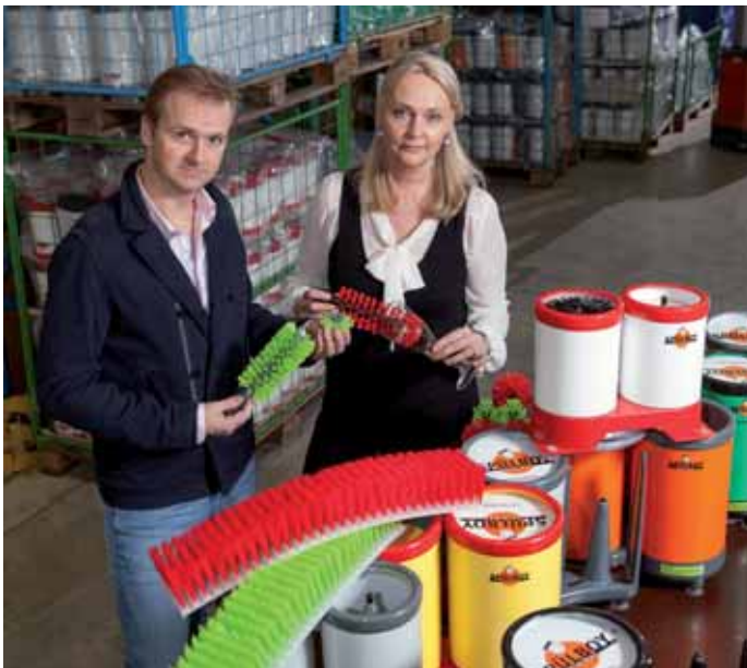
36 Der Spülboy sorgt für saubere Gläser