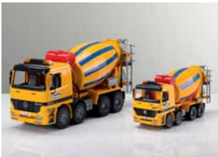
Spielzeug-Betonmischer „MB Actros“*