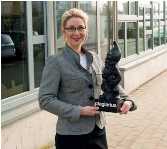
10 Im Kampf gegen die Markenpiraterie