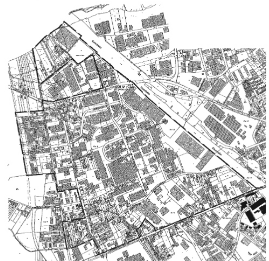
Plan zur Veränderungssperre Nr. 48

Teile der Fluren 1, 2, 3, 4, 11, 12 und 13 der Gemarkung Hilden ohne Maßstab